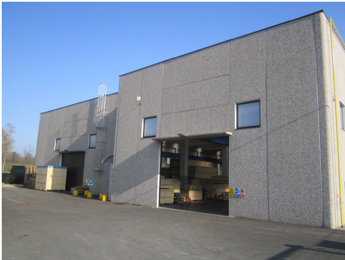
1 - vista prospetto nord