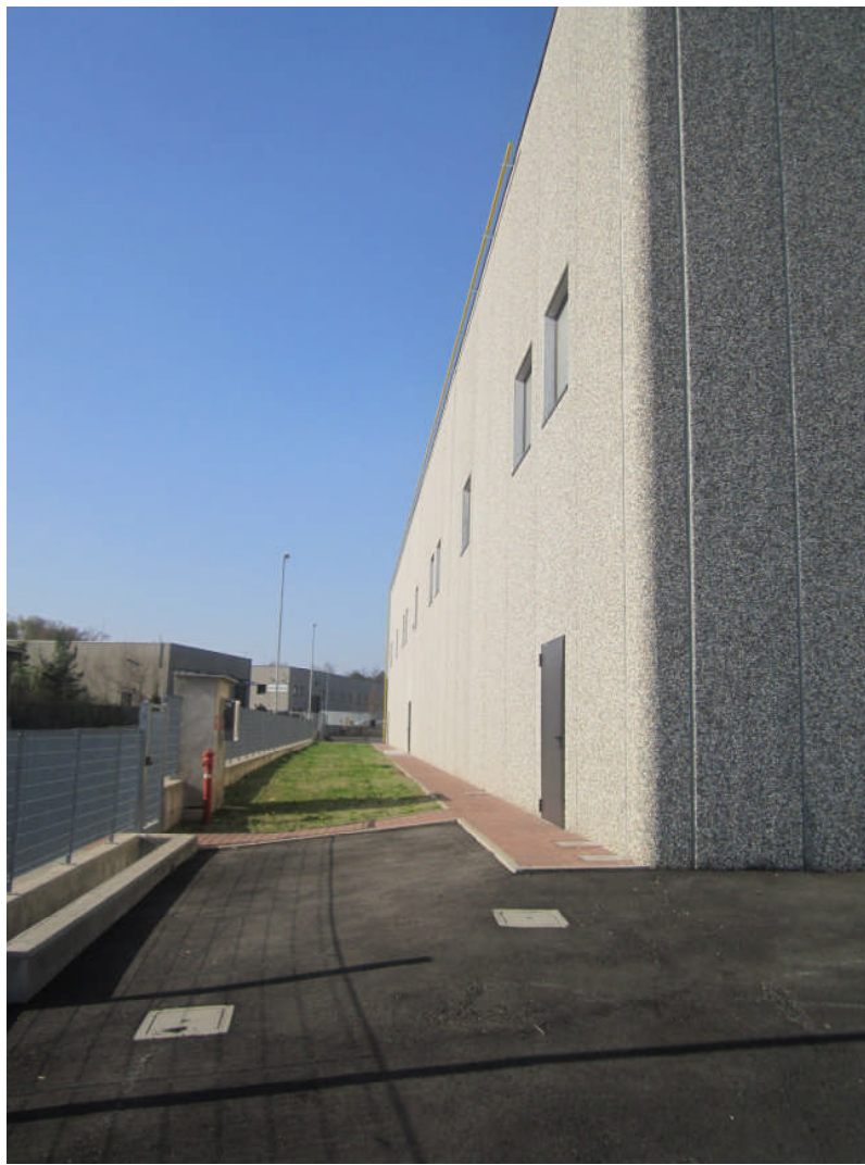
5 - vista prospetto ovest dall'interno della proprietà