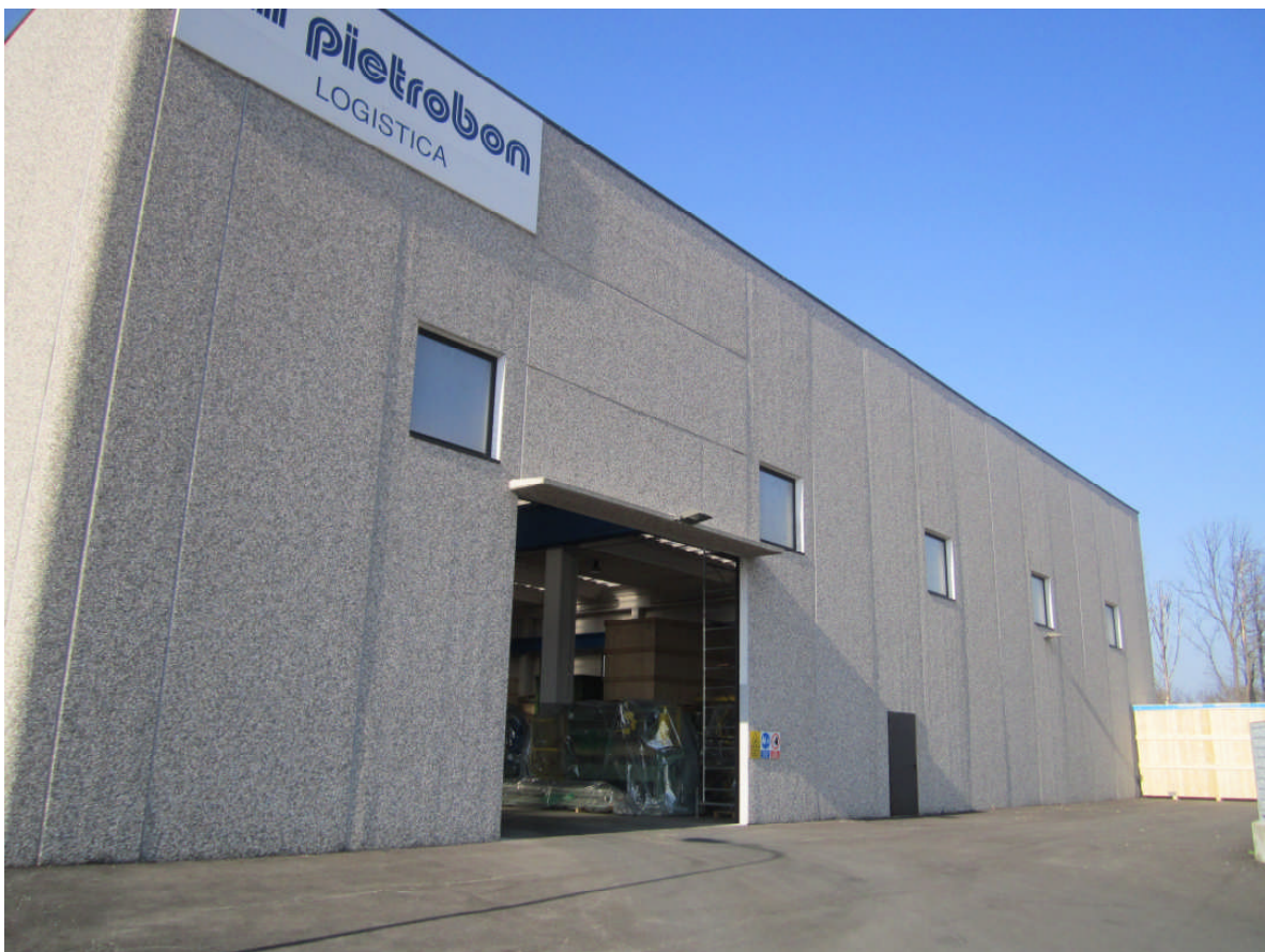
4 - vista prospetto sud