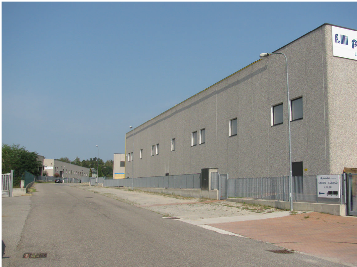
6 - vista prospetto ovest dalla via San Severo