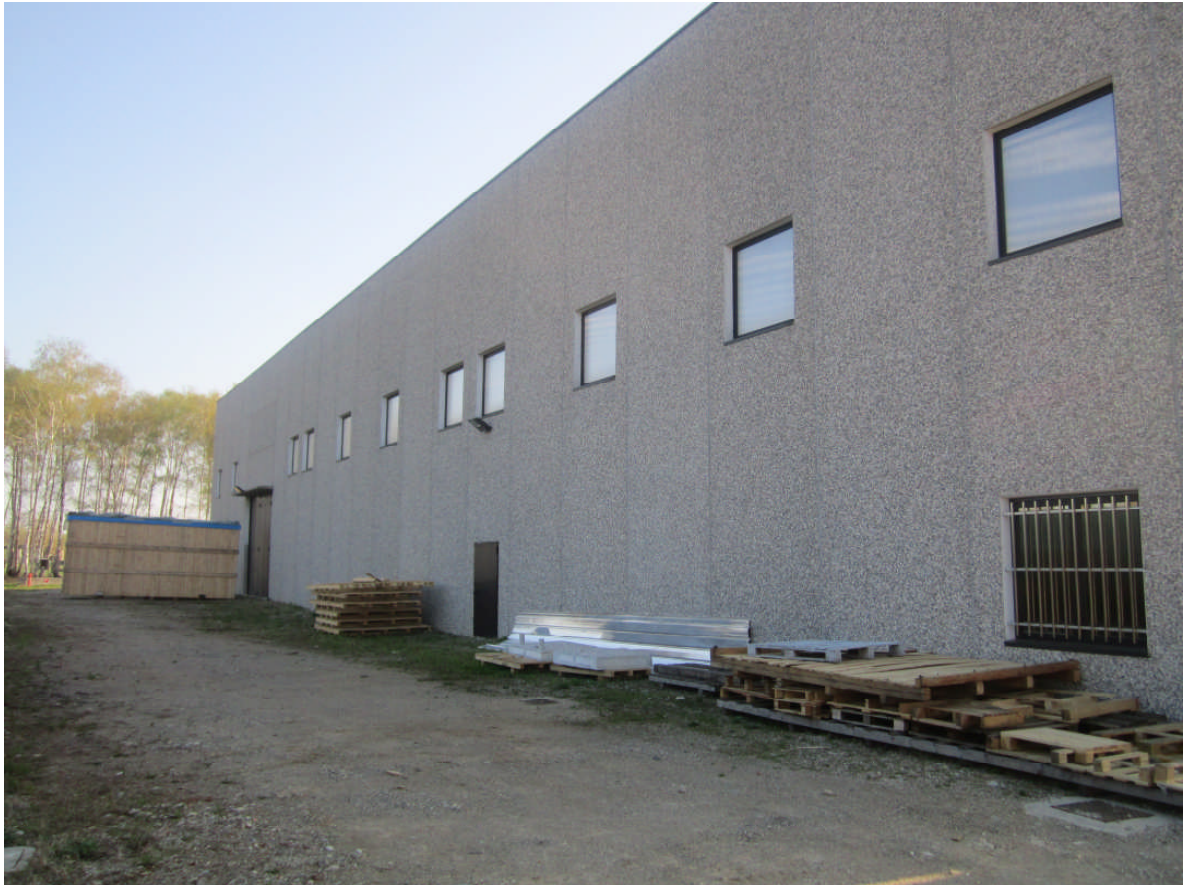
3 - vista prospetto est