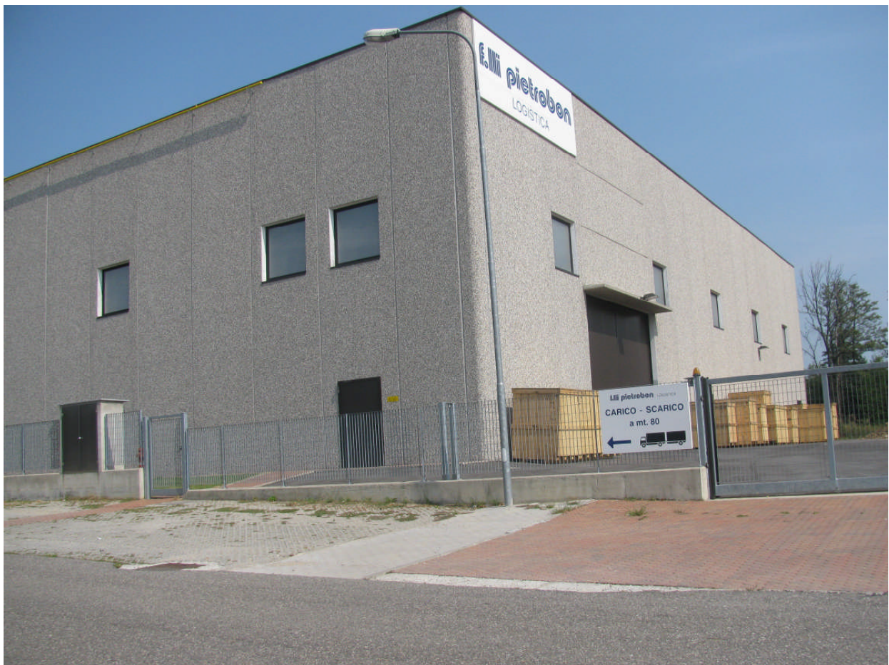
8 - vista prospetto sud dalla via San Severo