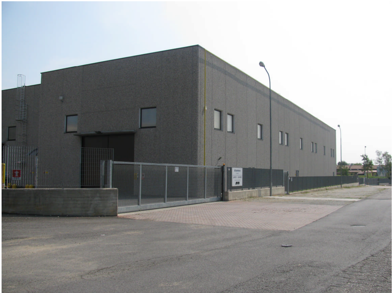
7 - vista prospetto ovest dalla via San Severo