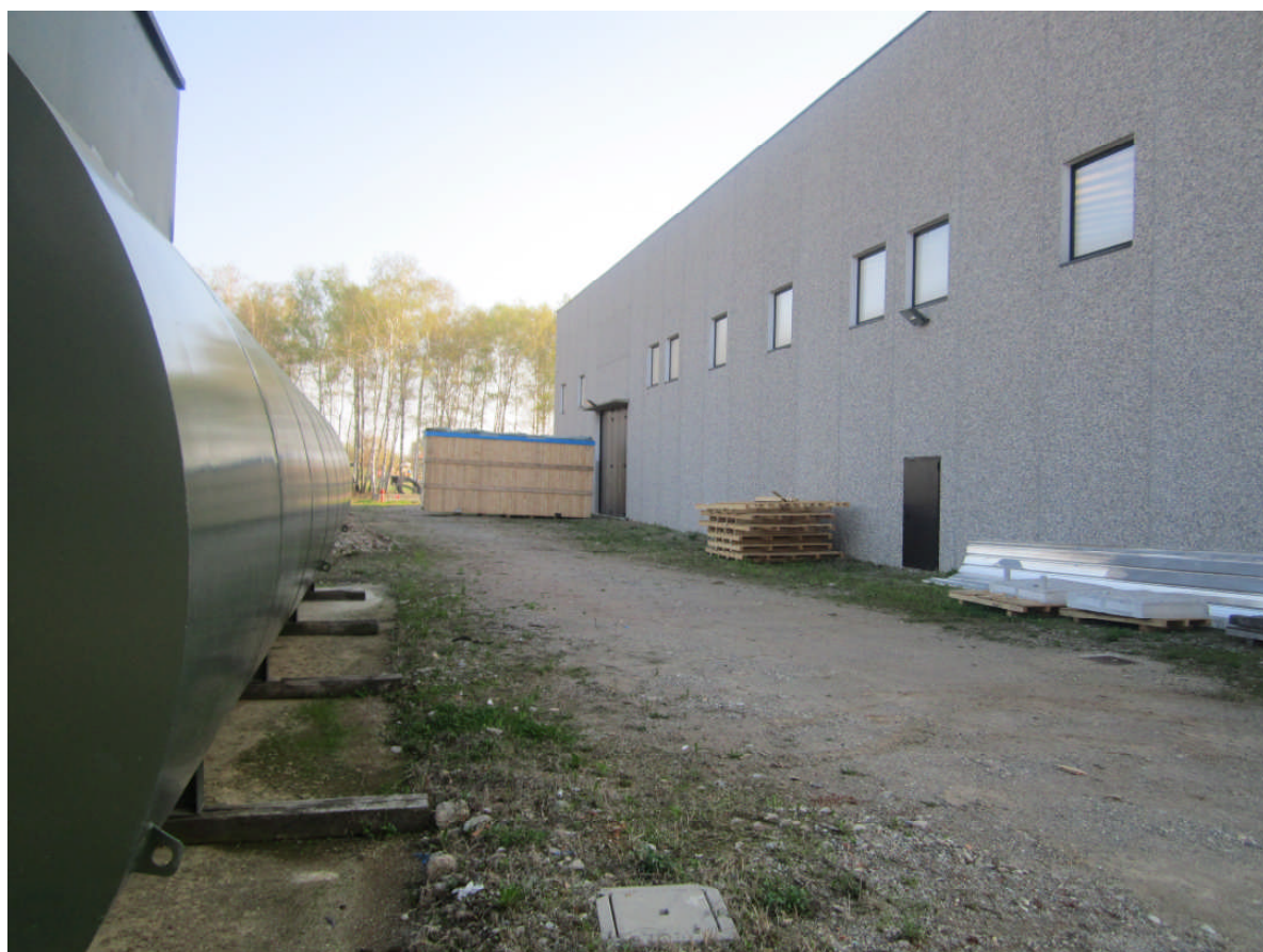
2 - vista prospetto est