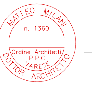
tavola 12 data revisione

ci si riserva la proprietà di questo elaborato, con divieto di riproduzione e di renderlo noto a terzi senza autorizzazione