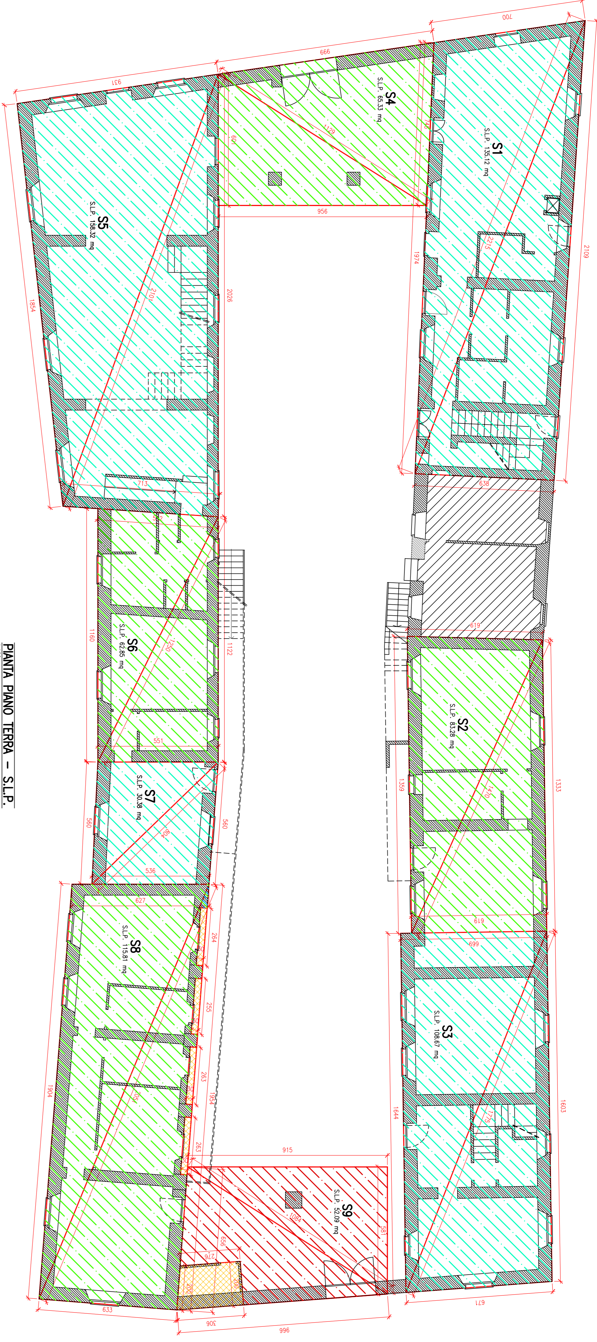
PANTIA PIANO TERRA - S.L.P. 1:100