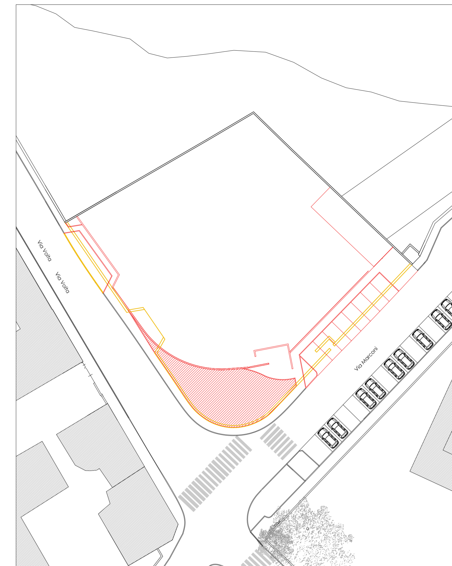
PLANIMETRIA SOVRAPPOSIZIONI scala 1:400