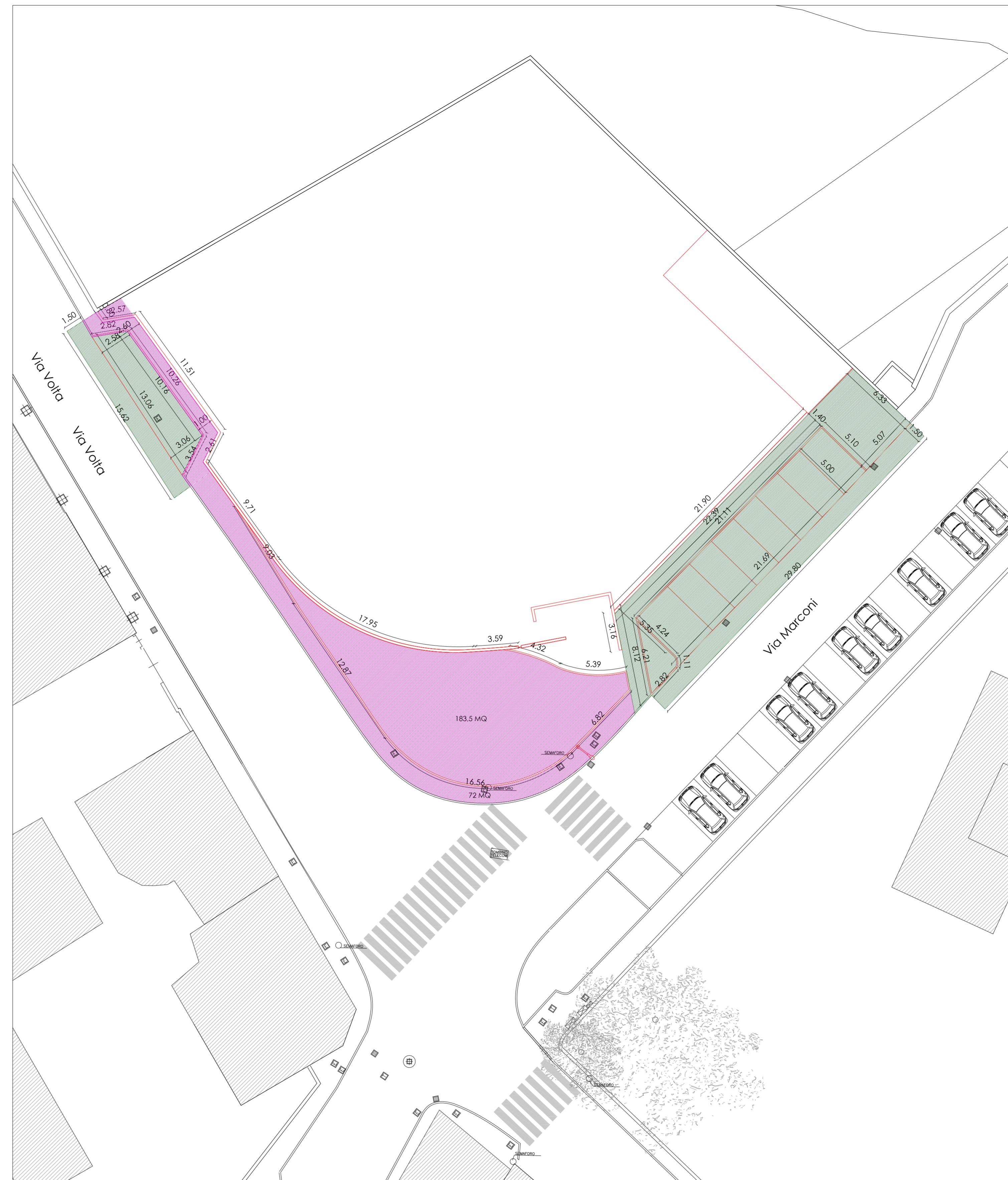
PLANIMETRIA NUOVE COSTRUZIONI Scala 1:200