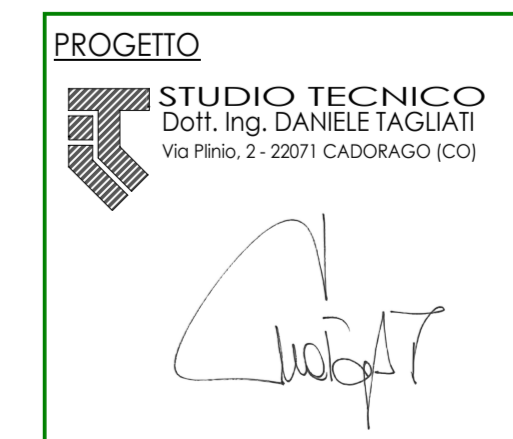
Tavola 3 di 21