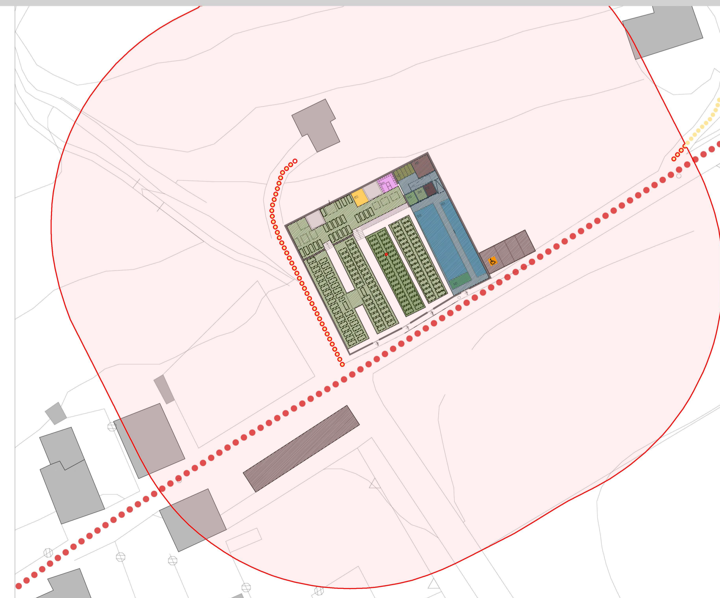
Planimetria di progetto scala 1:500