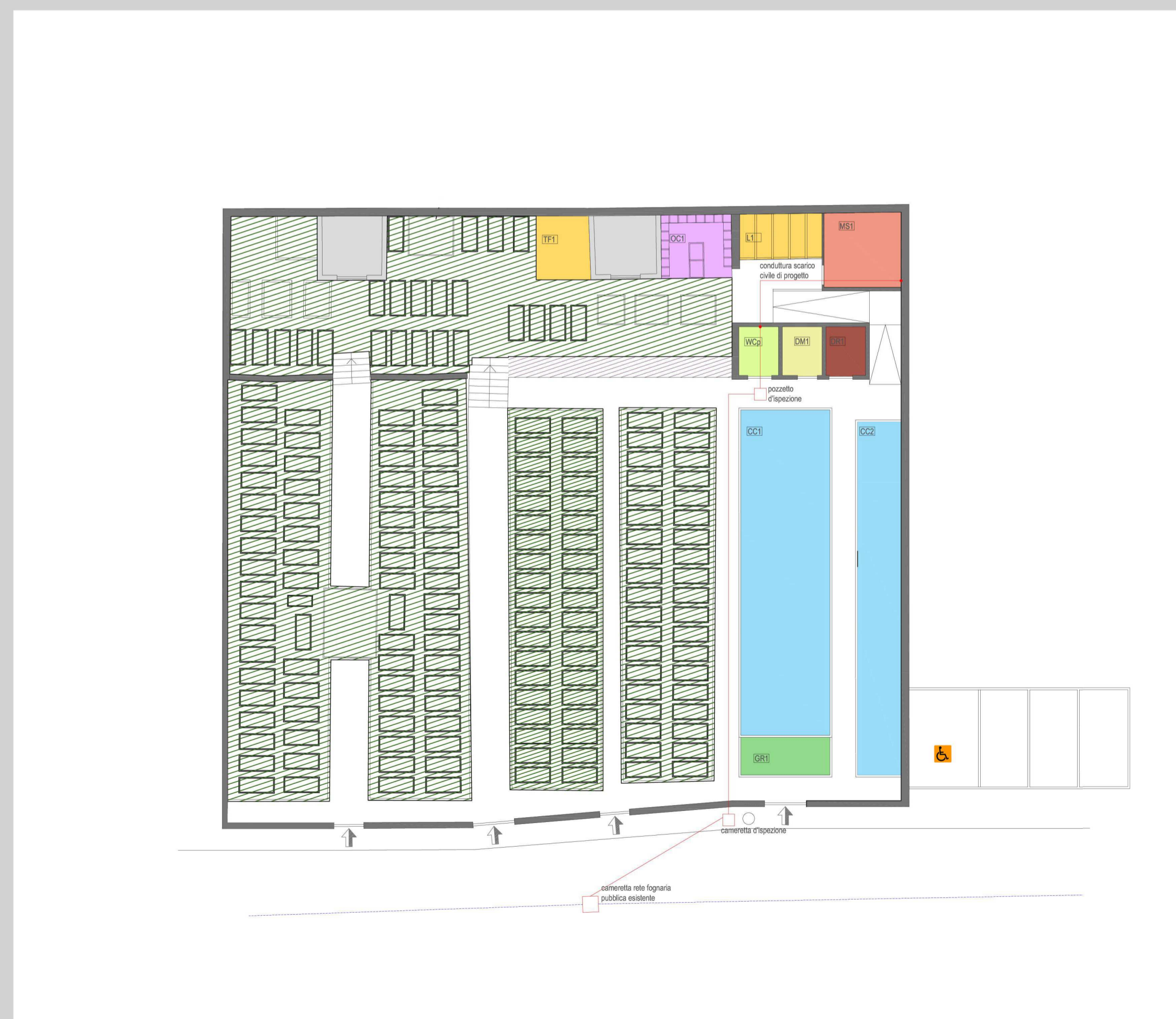
Planimetria di progetto scala 1:200