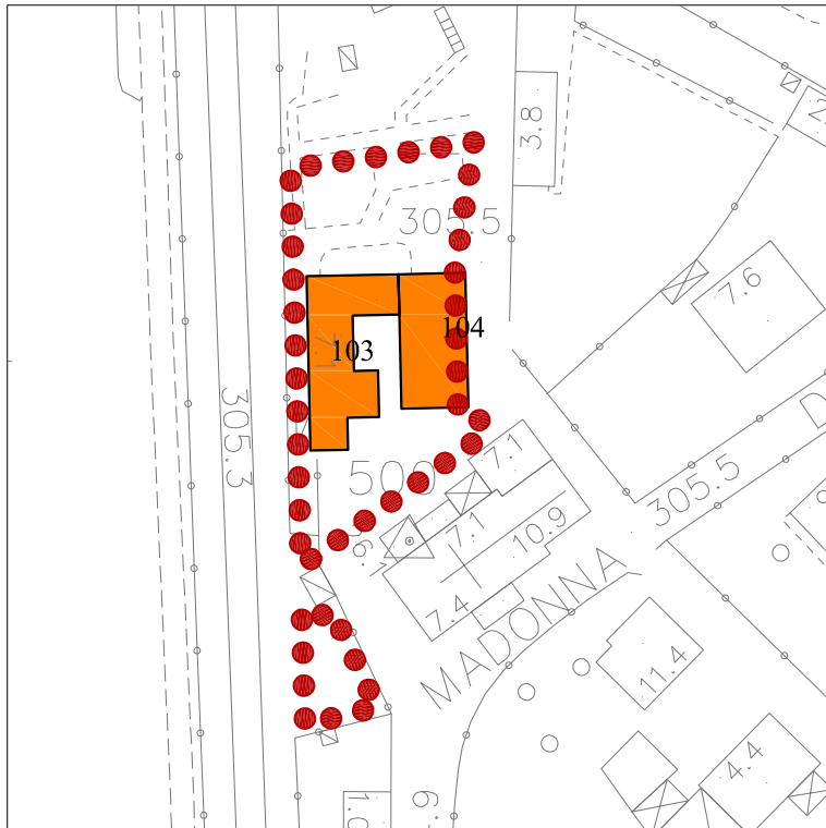
Località MADONNA DEL NOCE