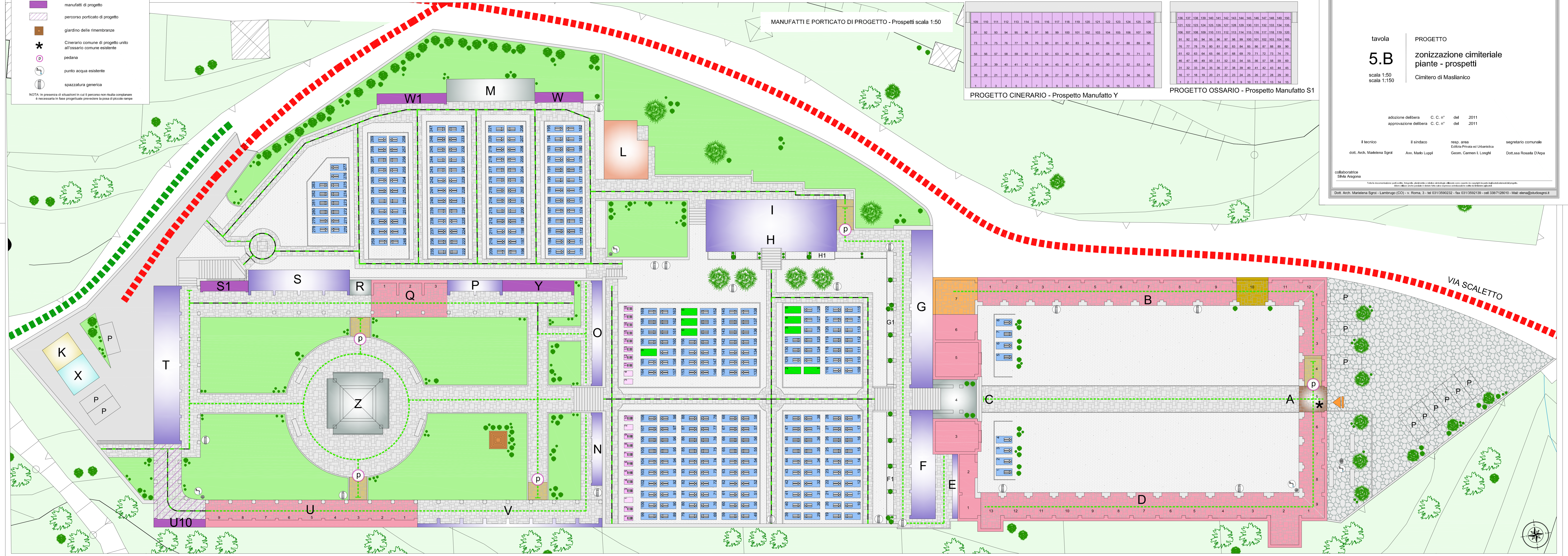
MANUFATTI E PORTICATO DI PROGETTO - Prospetti scala 1:50