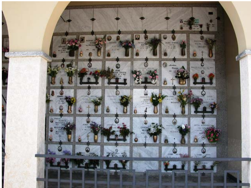
Loculi – Vista Lotto A