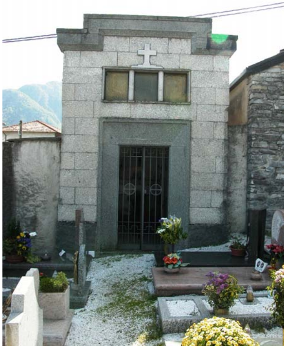
Cappella privata: VI