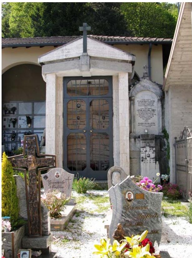
Cappella privata: XII