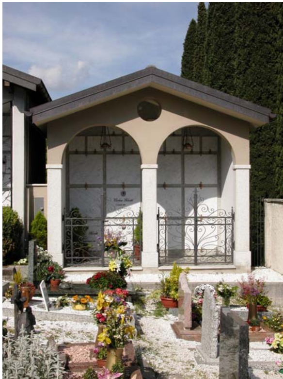
Cappelle private: VII-VIII