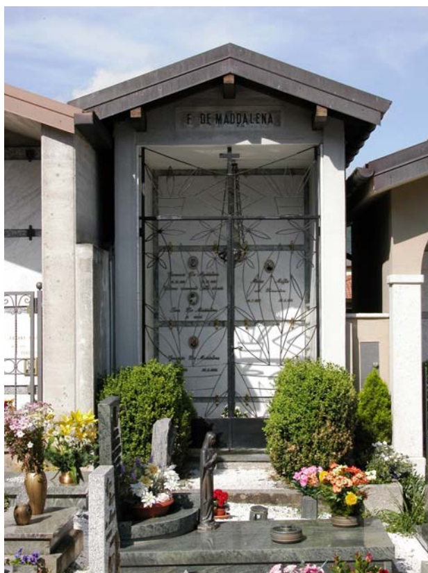
Cappella privata: IX