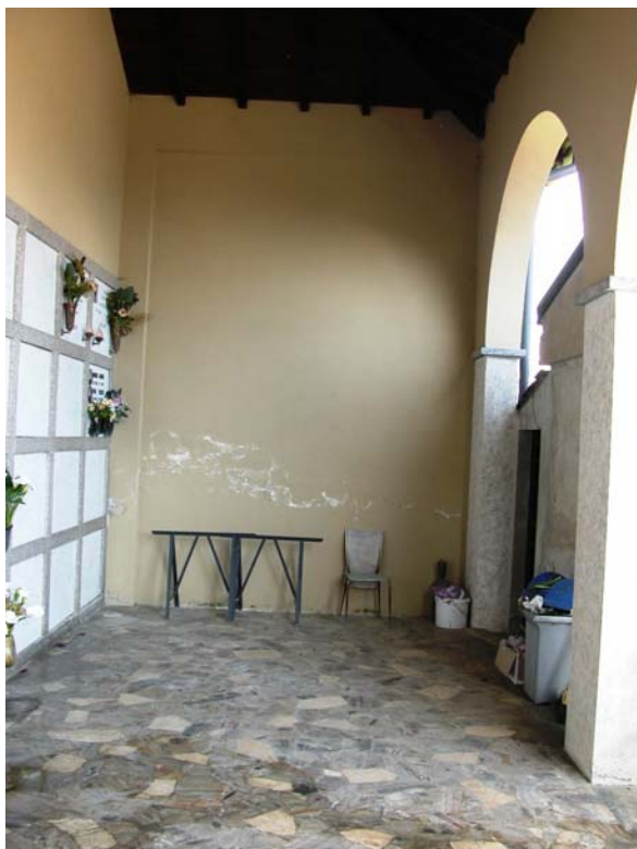
Ingresso ripostiglio esistente (sulla sinistra)