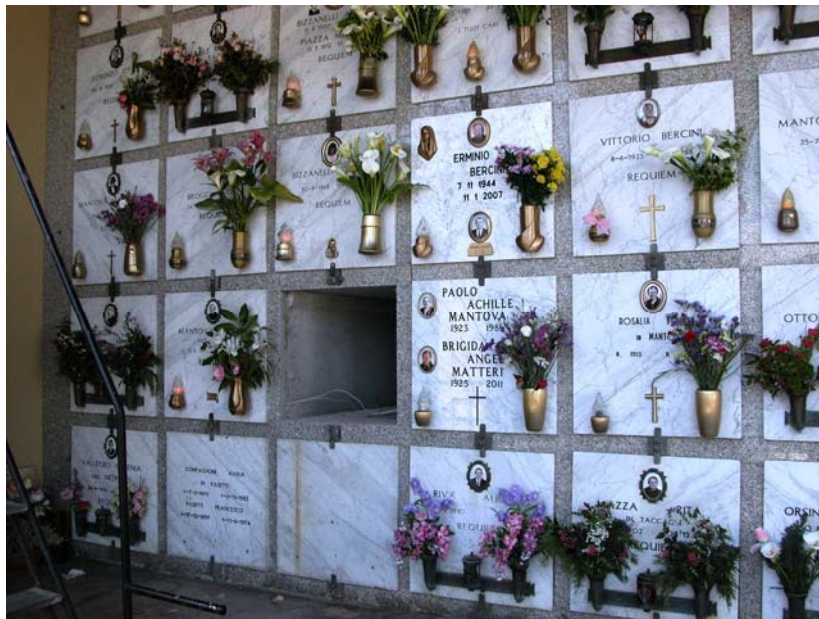
Loculi – Vista Lotto A