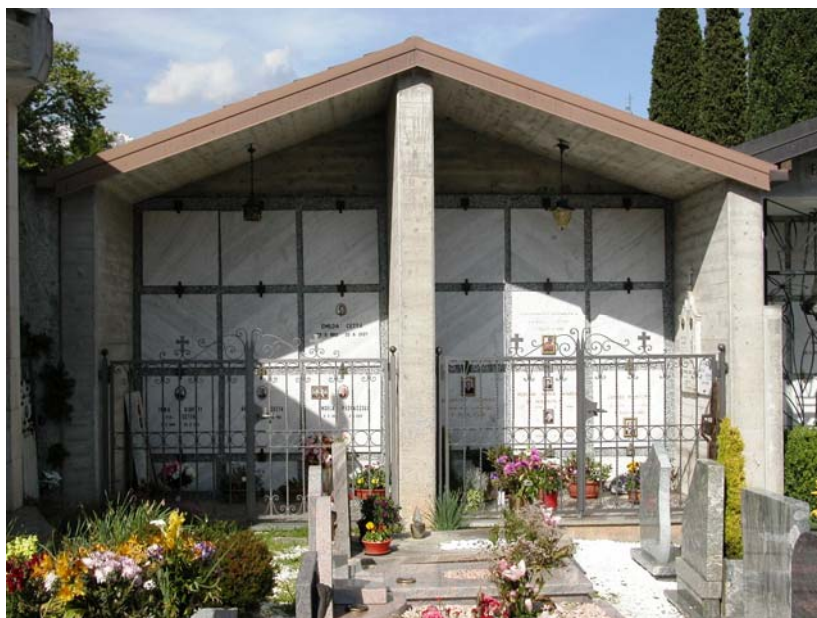
Cappelle private: X-XI