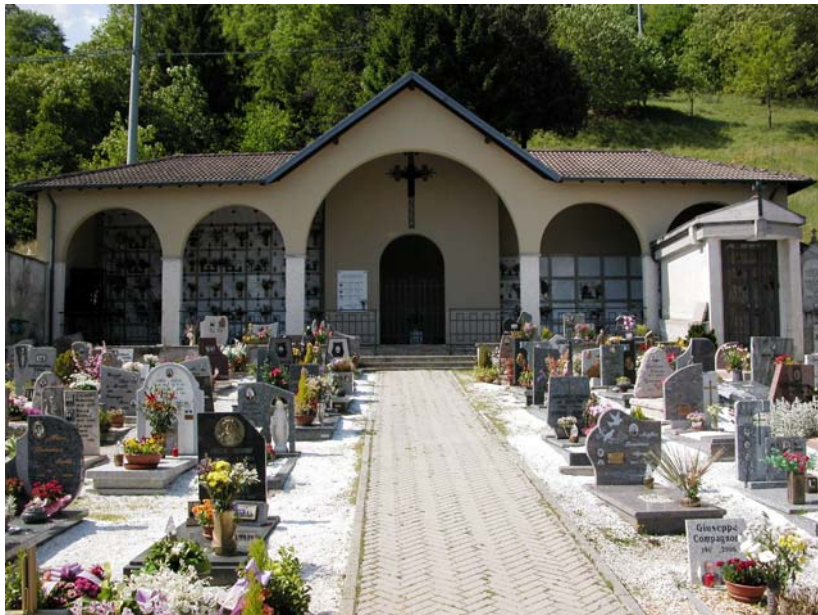
Campi comuni inumazione – Vista centrale dal viale di accesso ai loculi