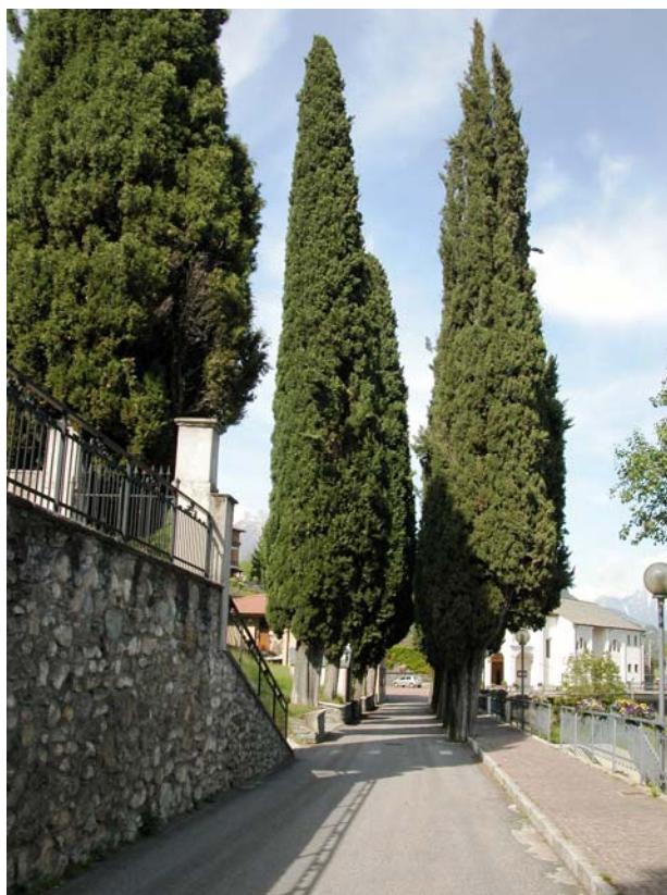
Il viale alberato di Via Alla Chiesa