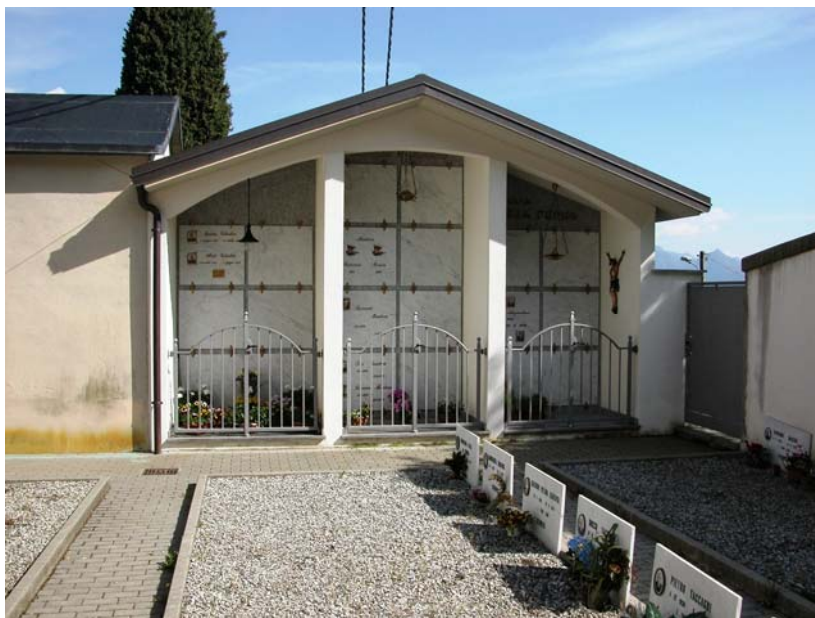
Cappelle private: I-II-III