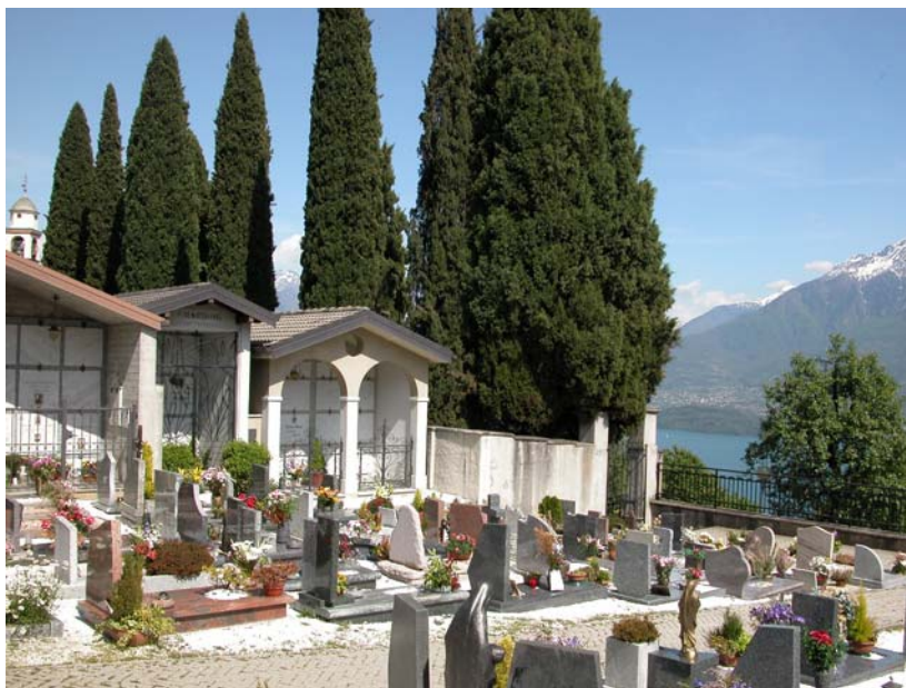
Campi comuni inumazione – Vista da ovest