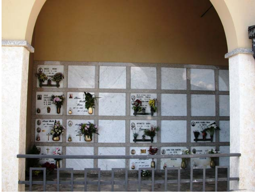
Loculi – Vista Lotto B