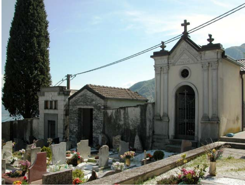
Campi comuni inumazione – Vista verso lato ovest