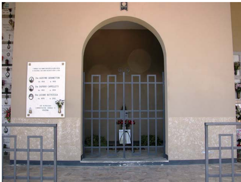
Vista frontale ingresso cappella votiva