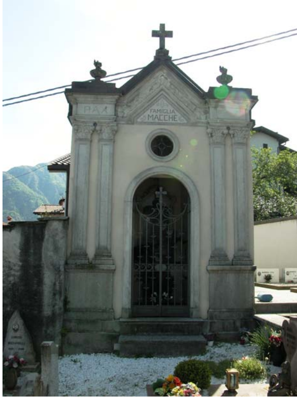
Cappella privata: IV