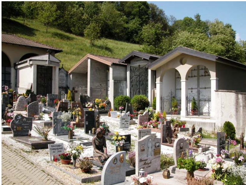
Campi comuni inumazione – Vista verso lato nord est