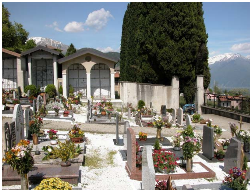
Campi comuni inumazione – Vista da ovest