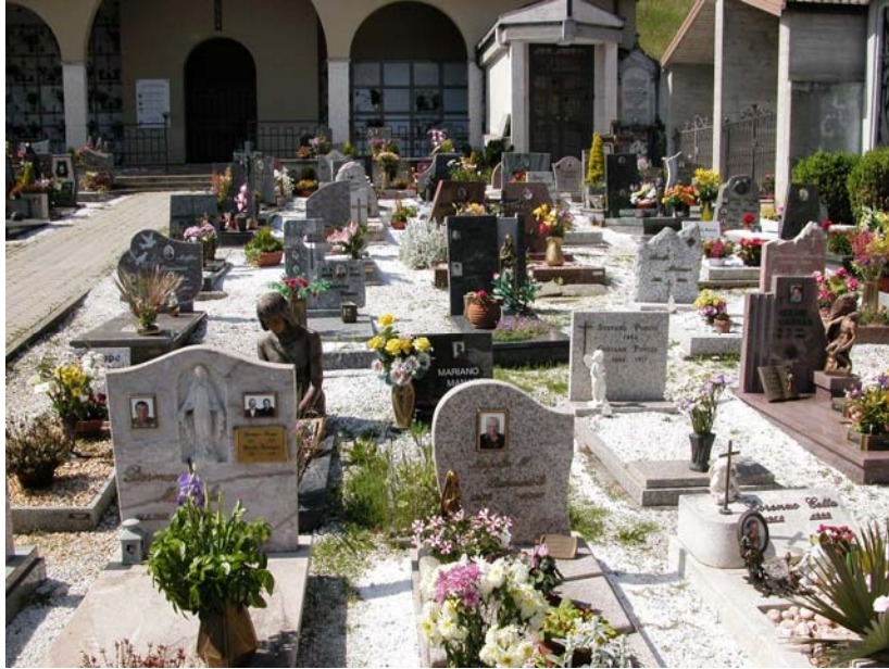
Campi comuni inumazione – Vista da sud lato est