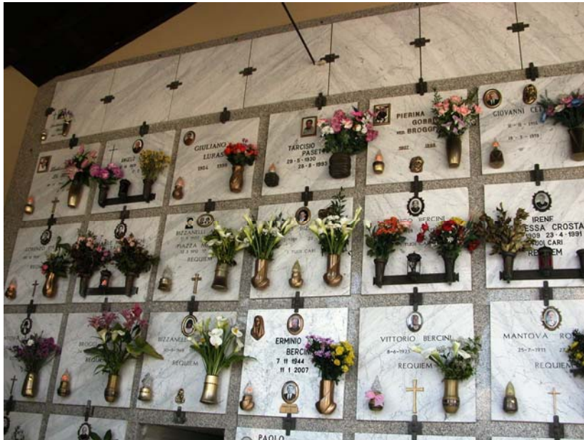
Loculi – Lotto A: particolare cellette ossario (ultima fila in alto)