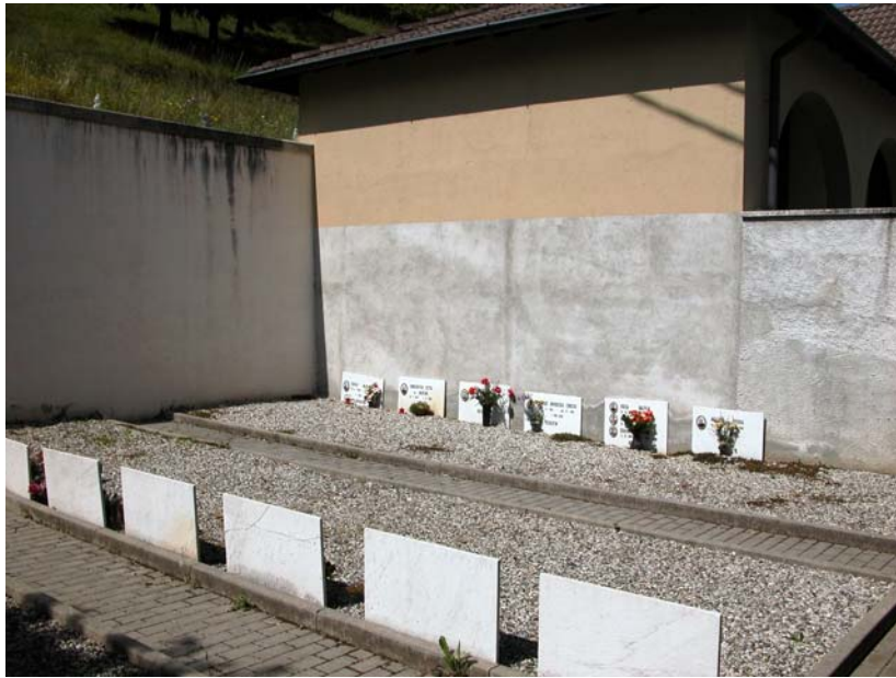
Campi di mineralizzazione – Vista lato nord est