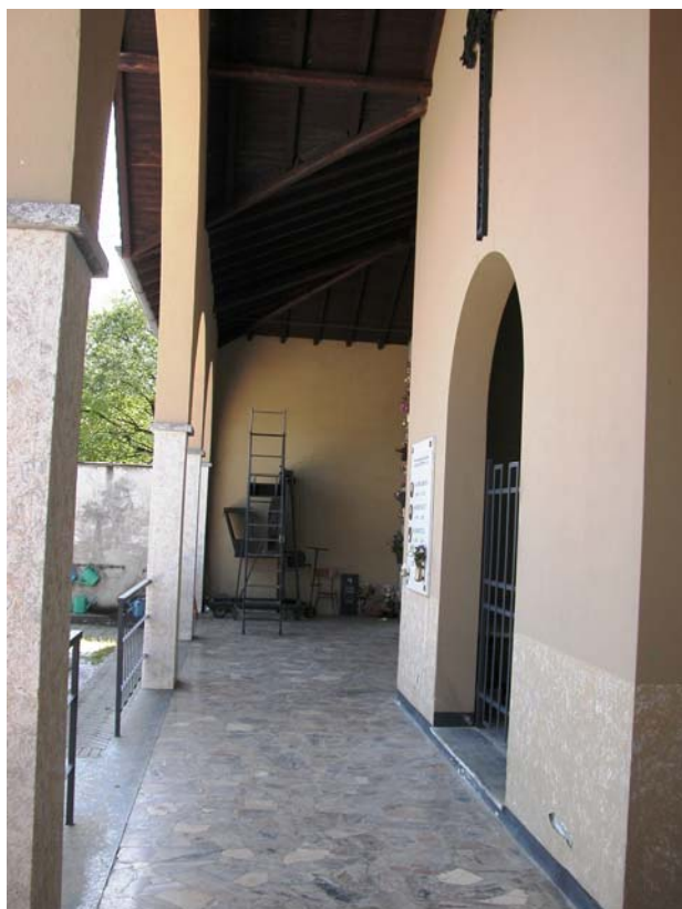
Vista laterale ingresso cappella votiva