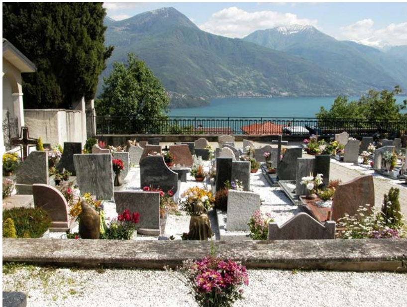
Campi comuni inumazione – Vista da nord lato est