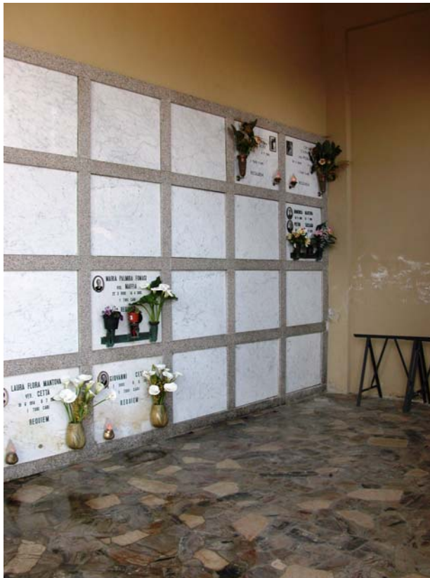
Loculi – Vista Lotto B