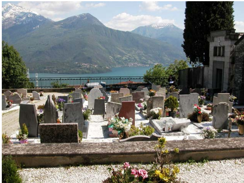
Campi comuni inumazione – Vista da nord lato ovest