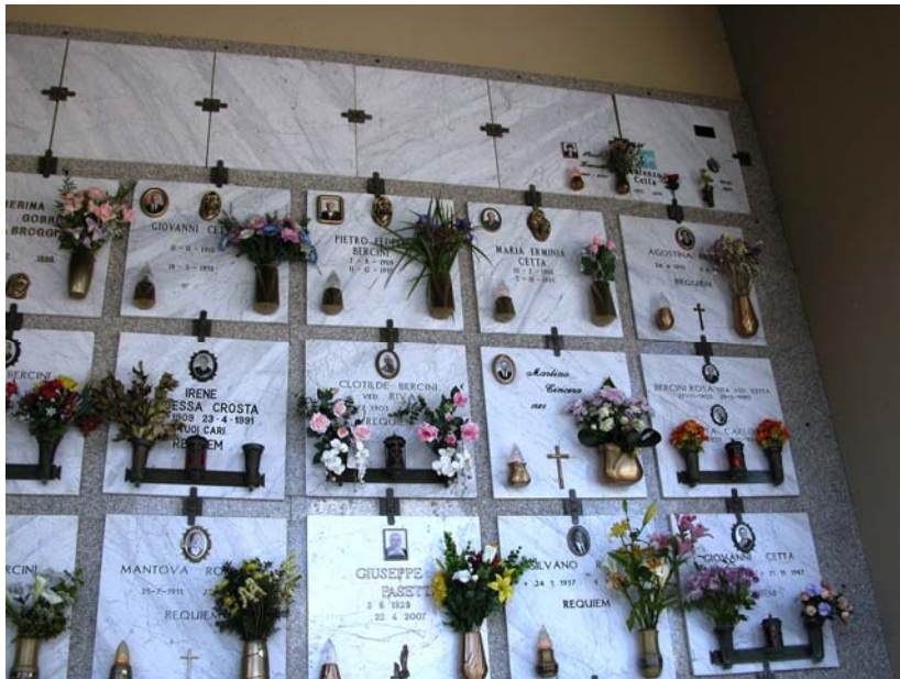
Loculi – Lotto A: particolare cellette ossario occupate (ultima fila in alto)