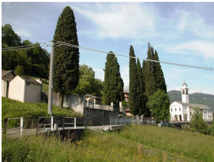
Via Alla Chiesa in prossimità del cimitero