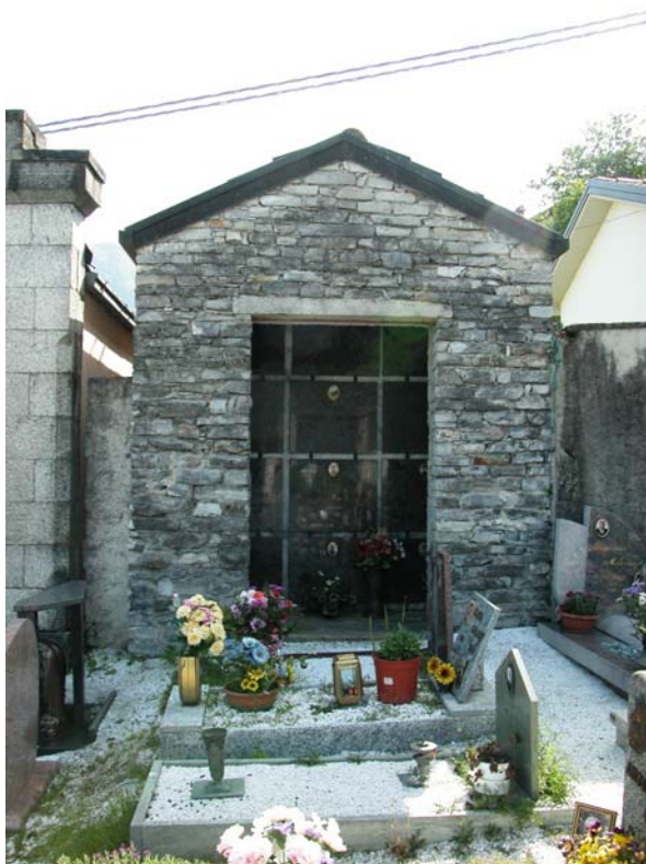
Cappella privata: V