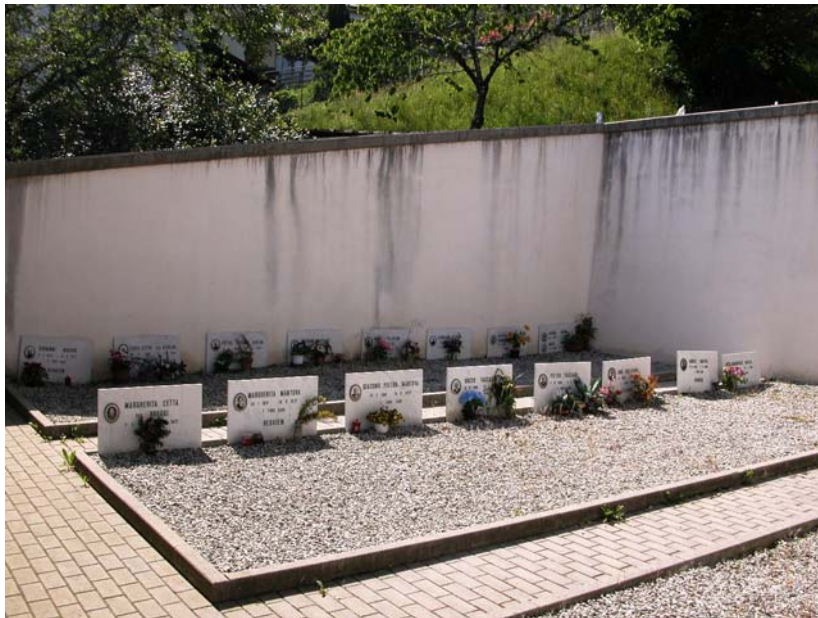
Campi di mineralizzazione – Vista lato nord ovest