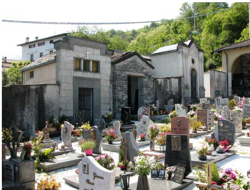
Campi comuni inumazione – Vista da sud lato ovest