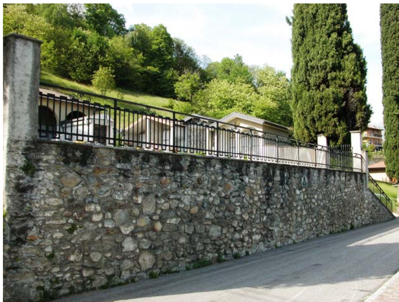
Lato sud del cimitero