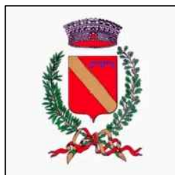
Comune di Albavilla

VISTA la d.g.r. del 11 luglio 2016, n. 5399, di approvazione del “Programma per la progettazione degli interventi strutturali e prioritari nelle aree a rischio idrogeologico molto elevato nonché conseguenti a calamità naturali”, che prevede di finanziare la progettazione di interventi urgenti e prioritari; VISTO il d.d.g. 20 settembre 2016, n. 9081 “Individuazione degli enti attuatori degli interventi previsti dalla d.g.r. 11 luglio 2016, n. X/5399 - programma per la progettazione degli interventi strutturali e prioritari nelle aree a rischio idrogeologico molto elevato nonché conseguenti a calamità”