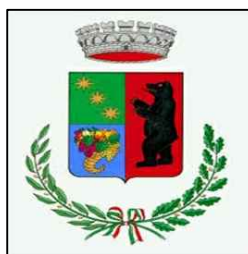
Comune di Tavernerio