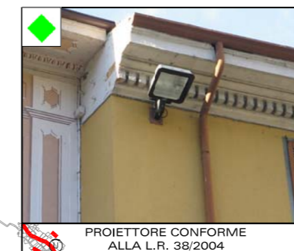
PROIETTORE CONFORME ALLA L.R. 38/2004