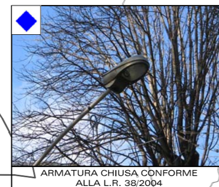
ARMATURA CHIUSA CONFORME ALLA L.R. 38/2004