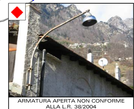
ARMATURA APERTA NON CONFORME ALLA L.R. 38/2004