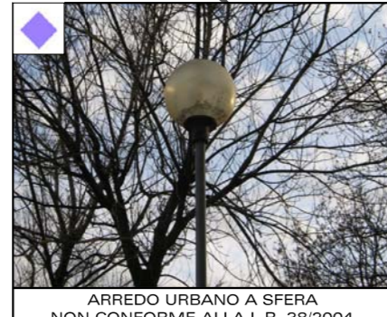
ARREDO URBANO A SFERA NON CONFORME ALLA L.R. 38/2004