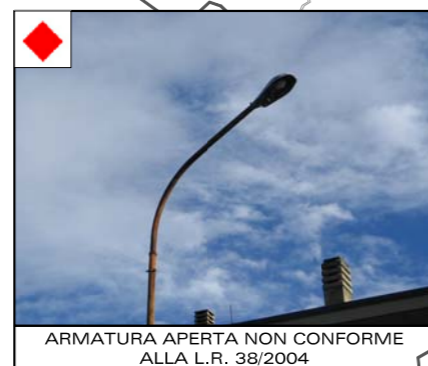
ARMATURA APERTA NON CONFORME ALLA L.R. 38/2004