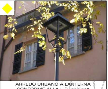
ARREDO URBANO A LANTERNA CONFORME ALLA L.R. 38/2004