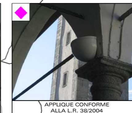
APPLIQUE CONFORME ALLA L.R. 38/2004