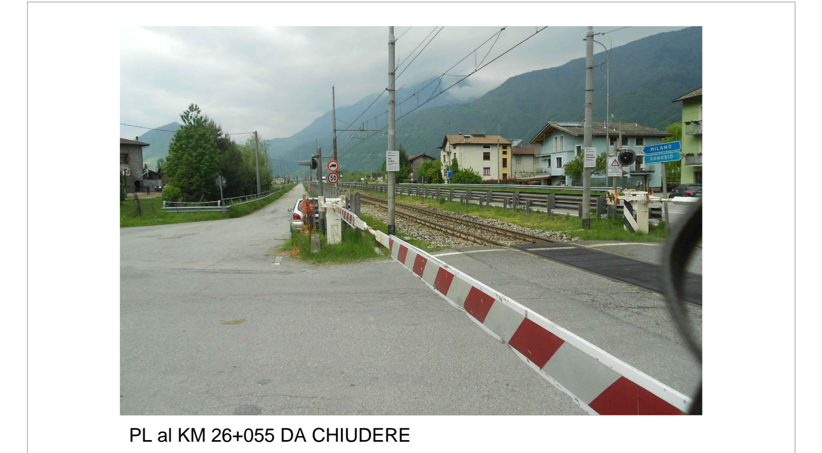
PL al KM 26+055 DA CHIUDERE