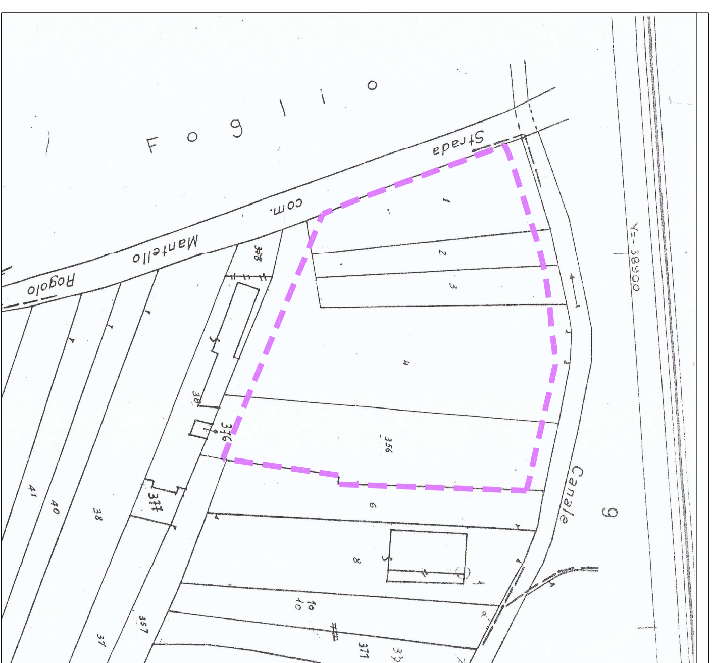
ESTRATTO DI MAPPA CATASTALE - FOGLIO N. - MAPPALI N° 1-2-3-4-356