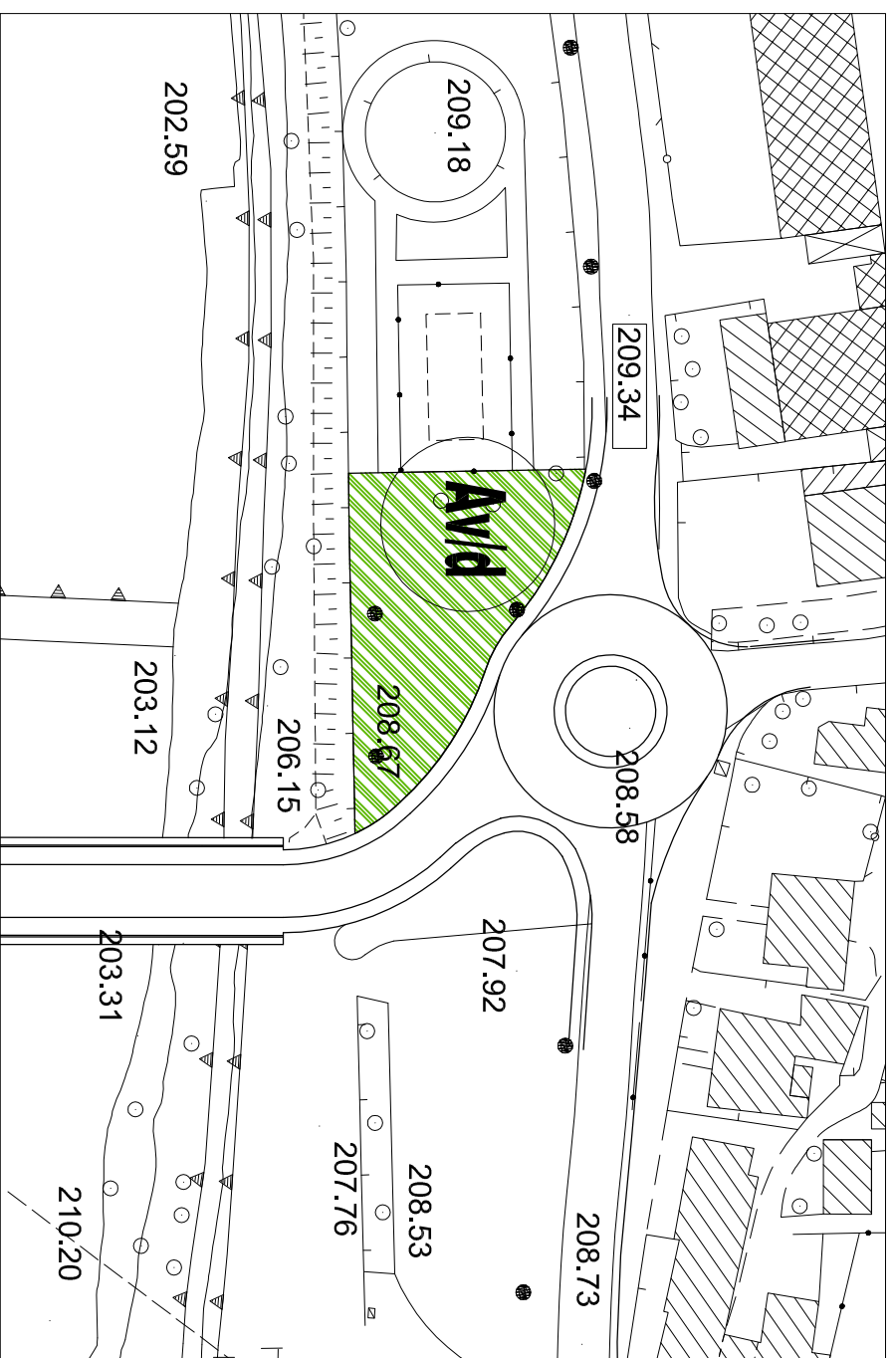
ESTRATTO PIANO DEI SERVIZI scala 1:1000

AREA TEMATICA : attrezzature sportive ed aree a verde