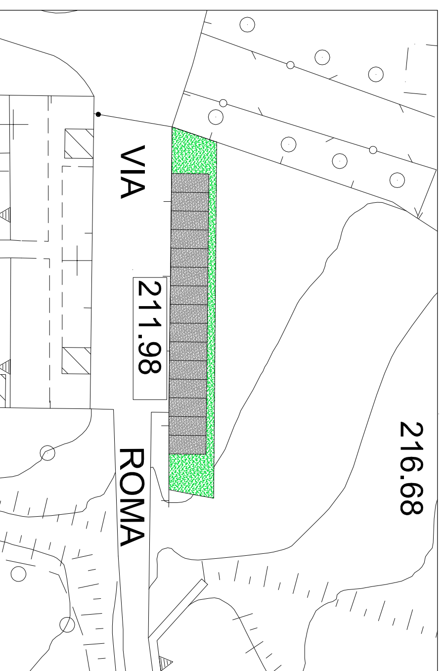
IPOTESI DI PROGETTO scala 1:500