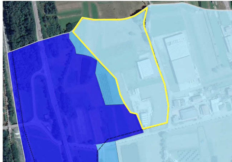
Figura 2: stralcio studio idraulico di dettaglio ing. Begnis con evidenziato in giallo il poligono a bassa pericolosità (L)

Lo sbaglio sulla Carta PAI/PGRA è stato poi reiterato nella Carta di Fattibilità, nella quale al suddetto poligono è stata quindi erroneamente attribuita una classe di fattibilità 3d (anziché 3e), come evidenziato alla figura seguente.