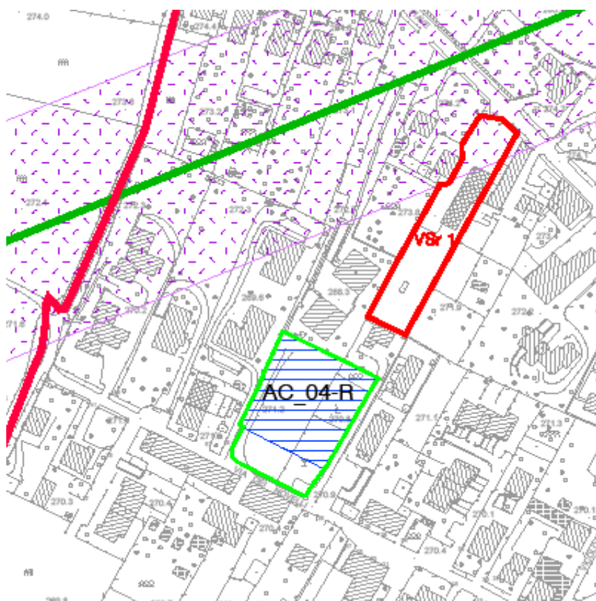
Estratto All. 4 del Documento di Piano "Ambiti di trasformazione e completamento"