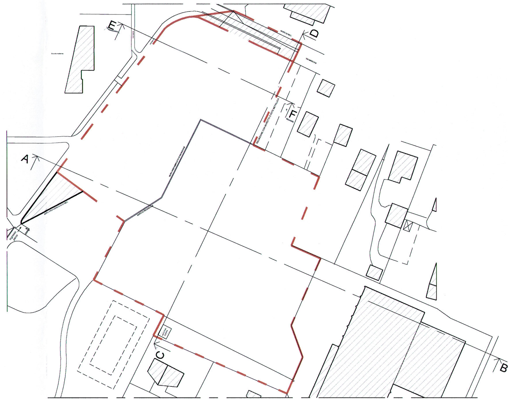
PLANIMETRIA - scala 1 : 1000