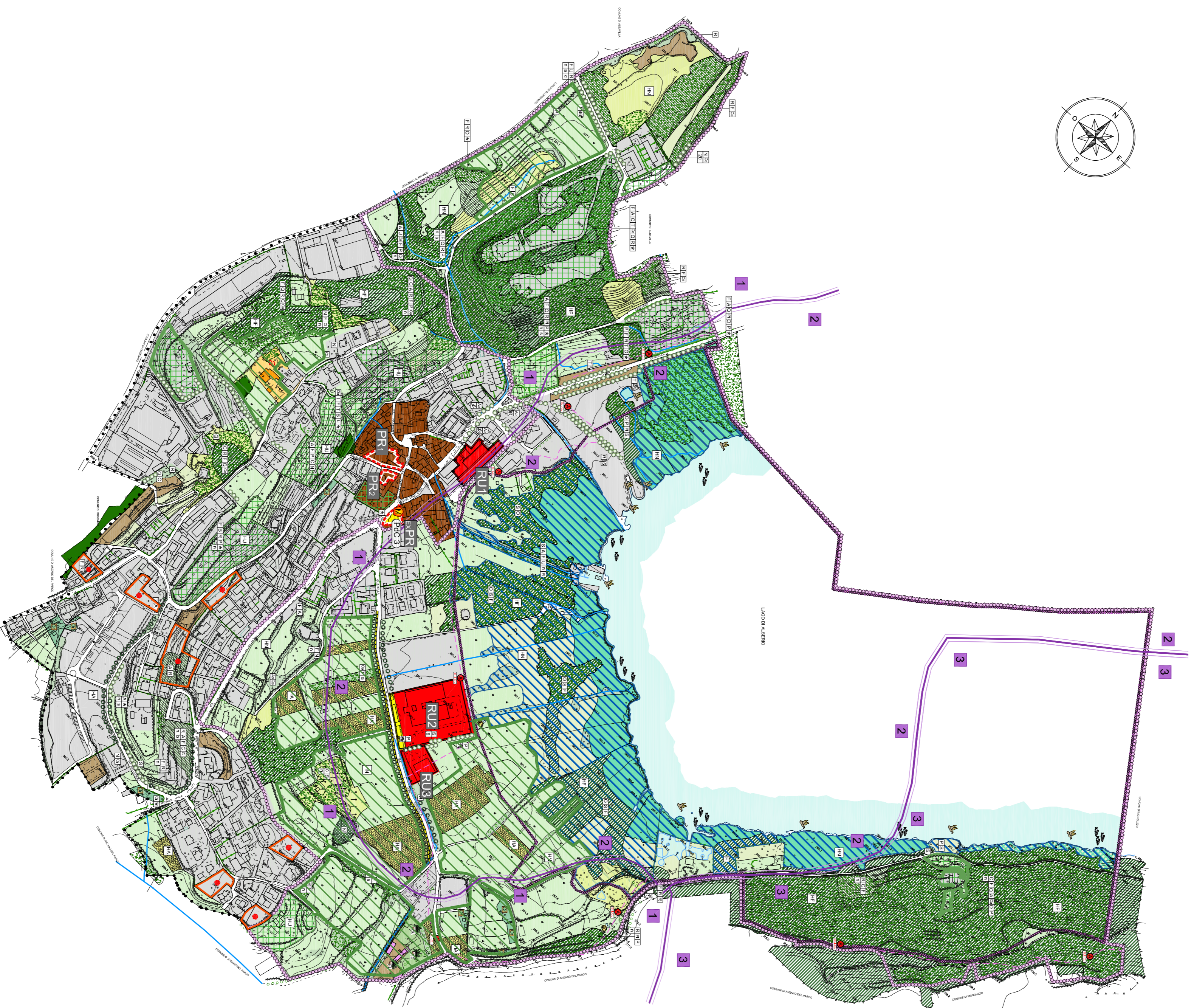
ELEMENTI PEDOLOGICI DEI SUOLI Banca dati DUSPENSARF - Rev. 01 del 2012