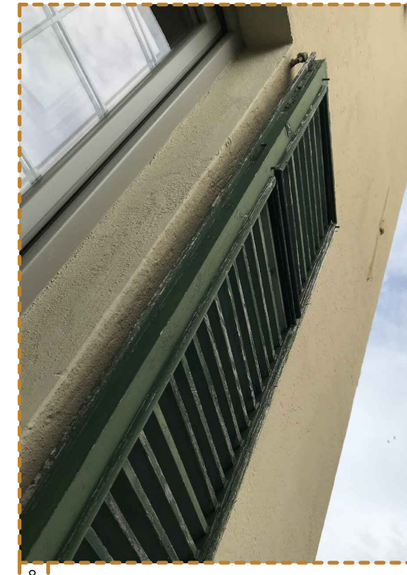
8 Dettaglio infisso