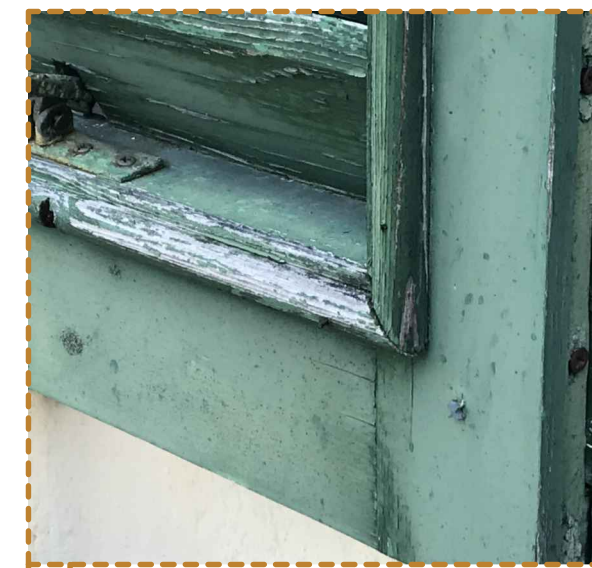
11 Dettaglio infisso