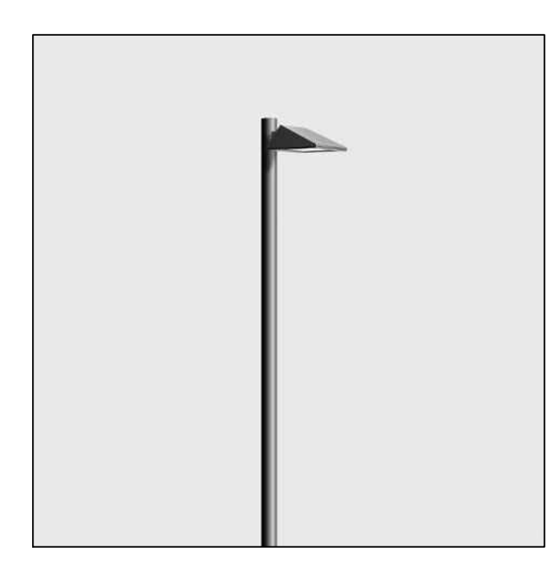
n. 14 lampione strada (Tipo 1)