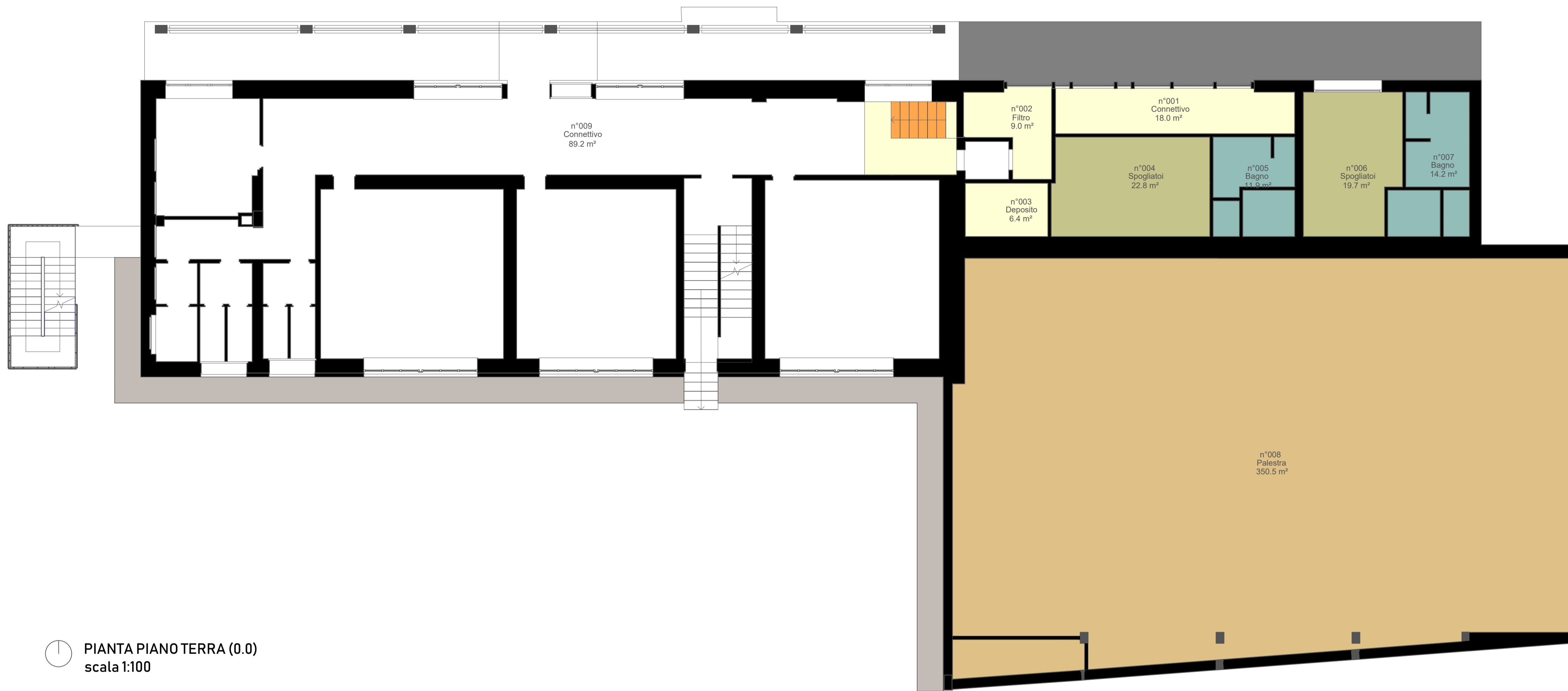
PIANTA PIANO TERRA (0.0) scala 1:100