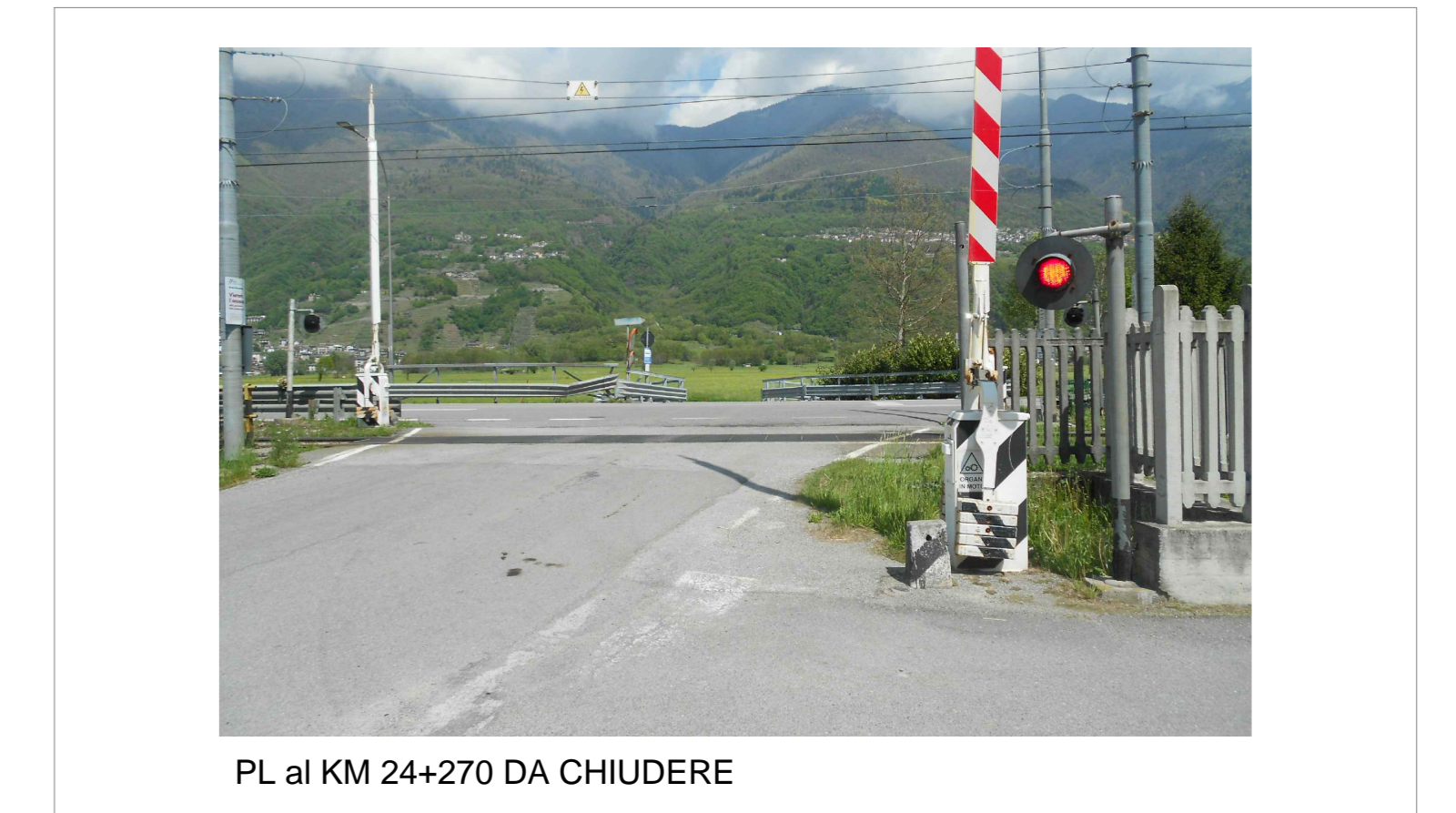
PL al KM 24+270 DA CHIUDERE