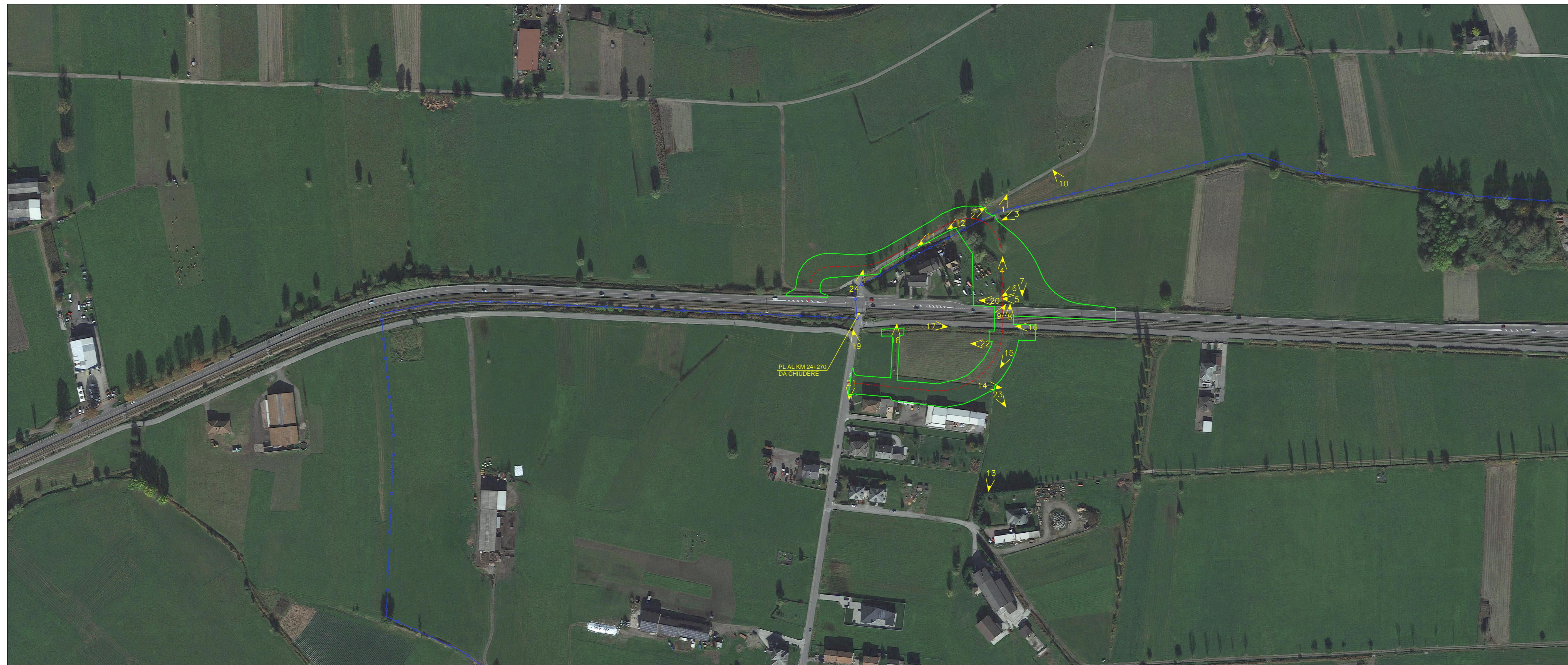
PLANIMETRIA SU ORTOFOTO - SCALA 1:2000