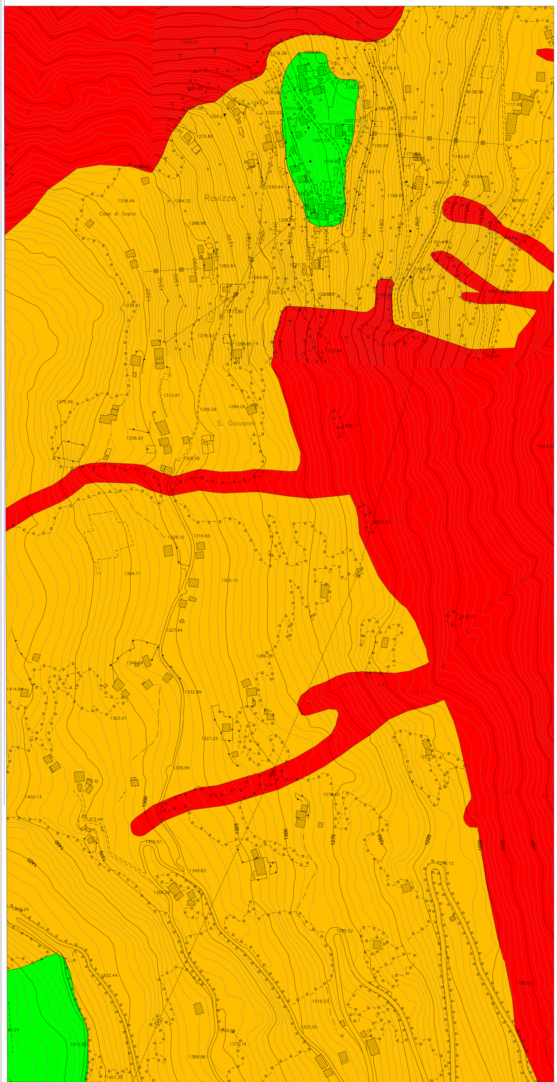
RAVIZZE e SAN GIOVANNI