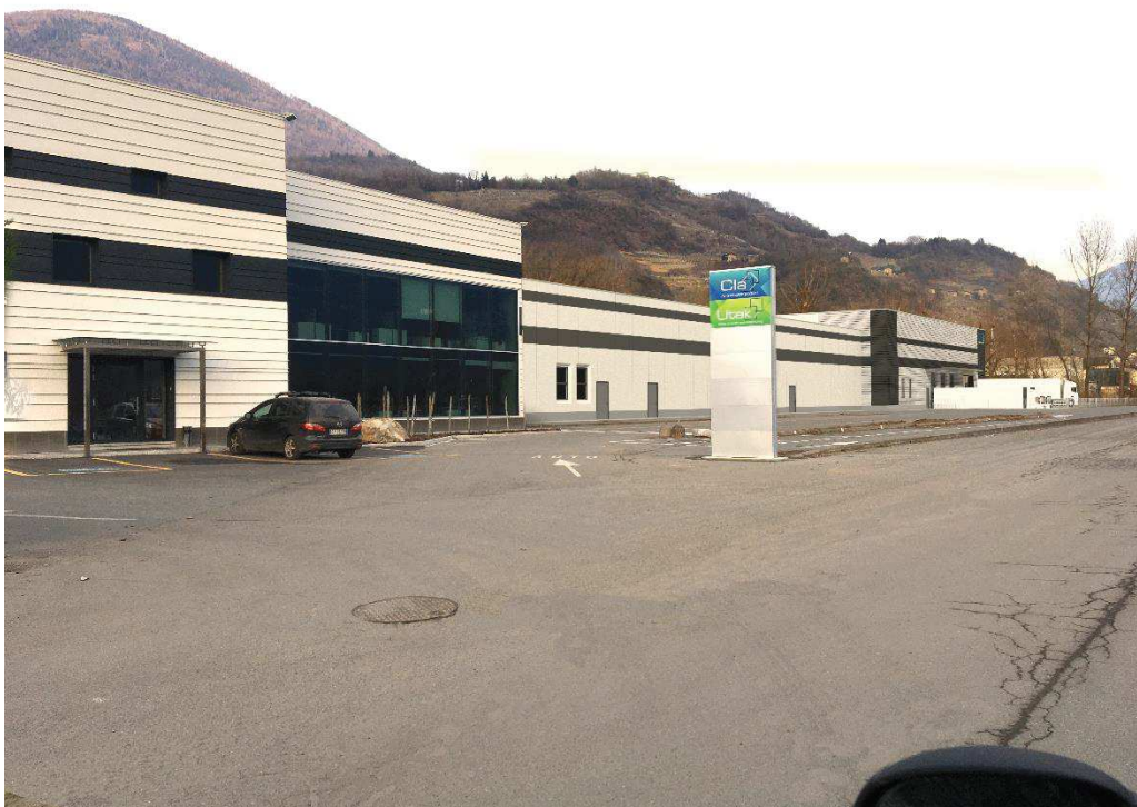
Foto 6: L'intero compendio fronte sud con l'ampliamento in progetto