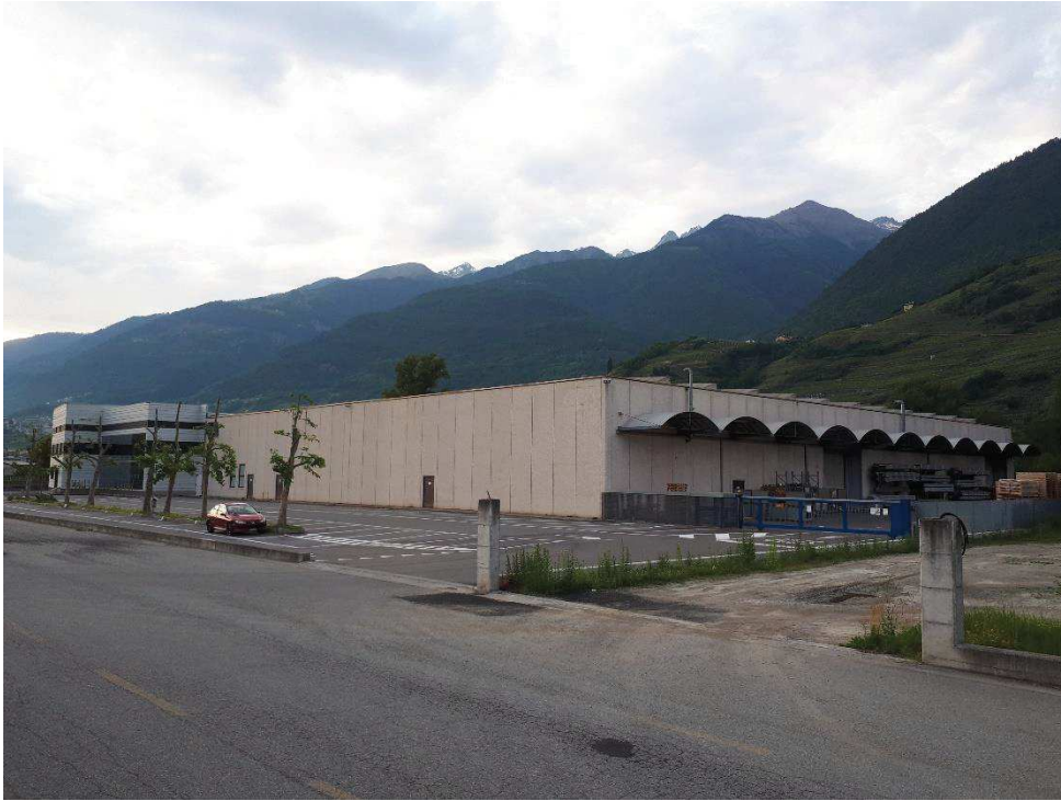
Foto 3: Sempre vista da est dell'ambito dove sorgerà l'ampliamento