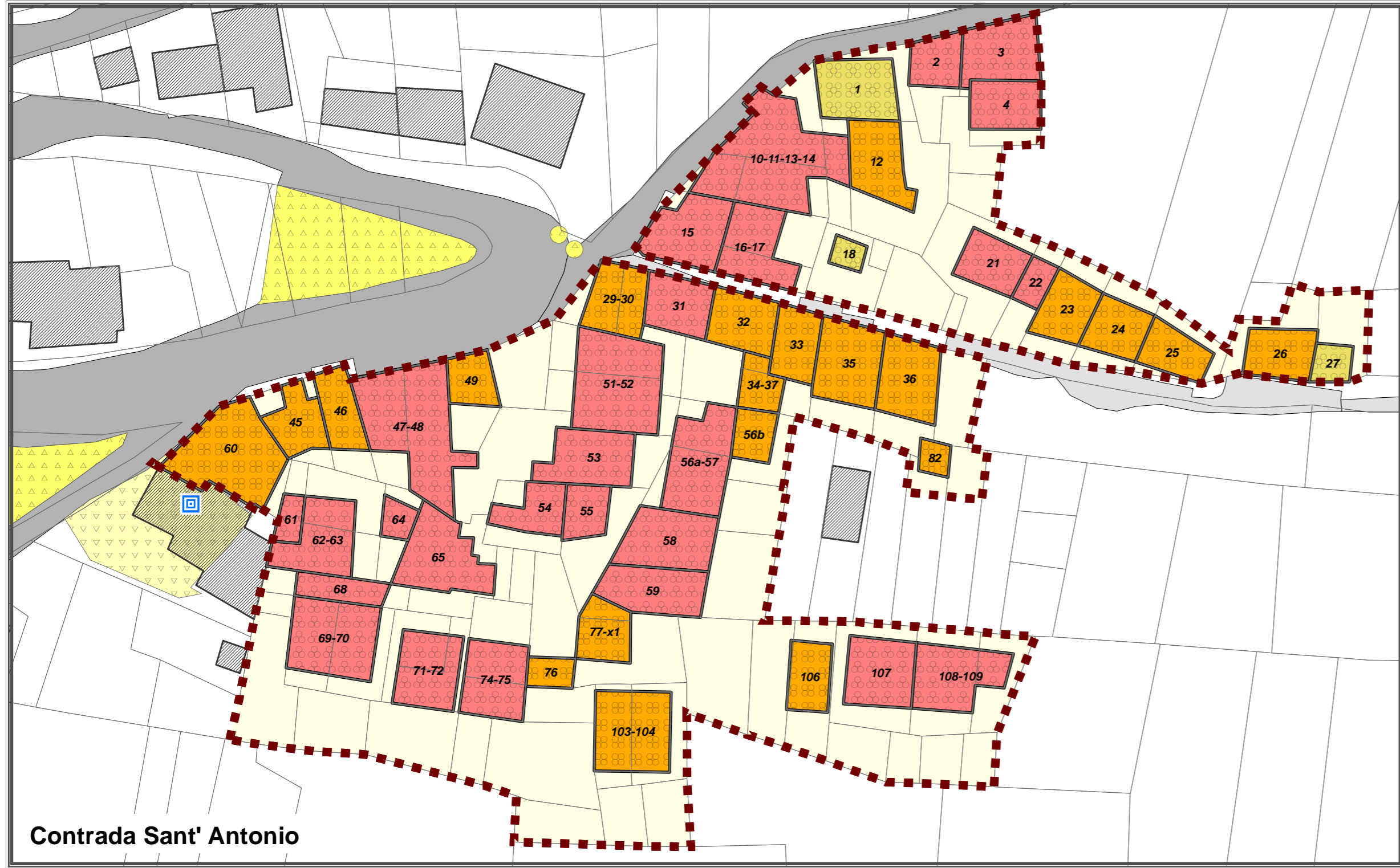
Contrada Sant' Antonio