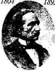
Paese natale di Cesare Cantù