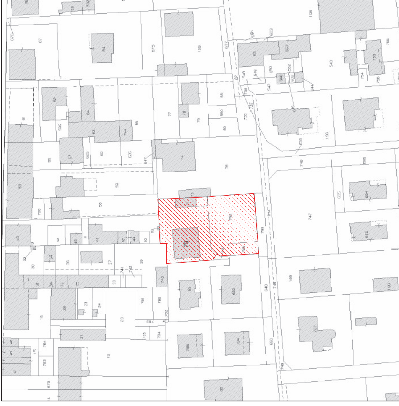
ESTRATTO DI MAPPA SCALA 1:1000 - Comune di Cogliate Foglio 14 - mappale 798 - 796 - 70 - 71