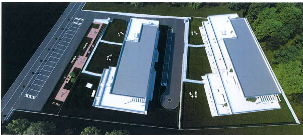
Figura 4. Inquadramento aereo dell'area di intervento.