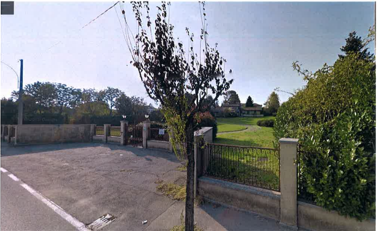
Figura 2. Ripresa fotografica da Via Cesare Battisti verso l'area di intervento.