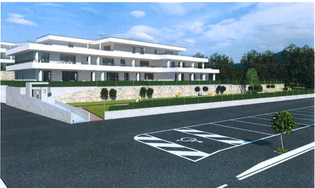
Figura 7. Ripresa fotografica da Via Cesare Battisti verso l'area di intervento.