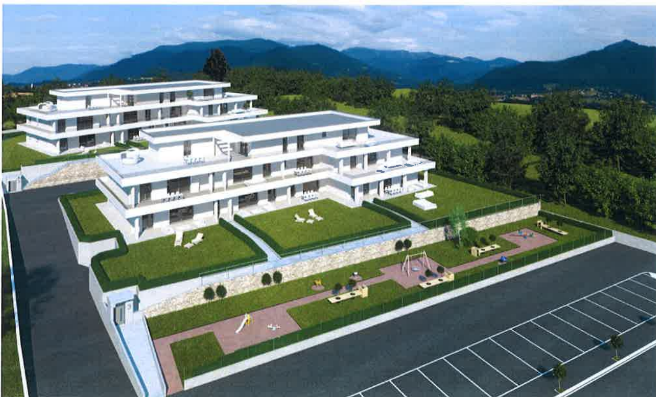
Figura 5. Ripresa fotografica aerea verso l'area di intervento.