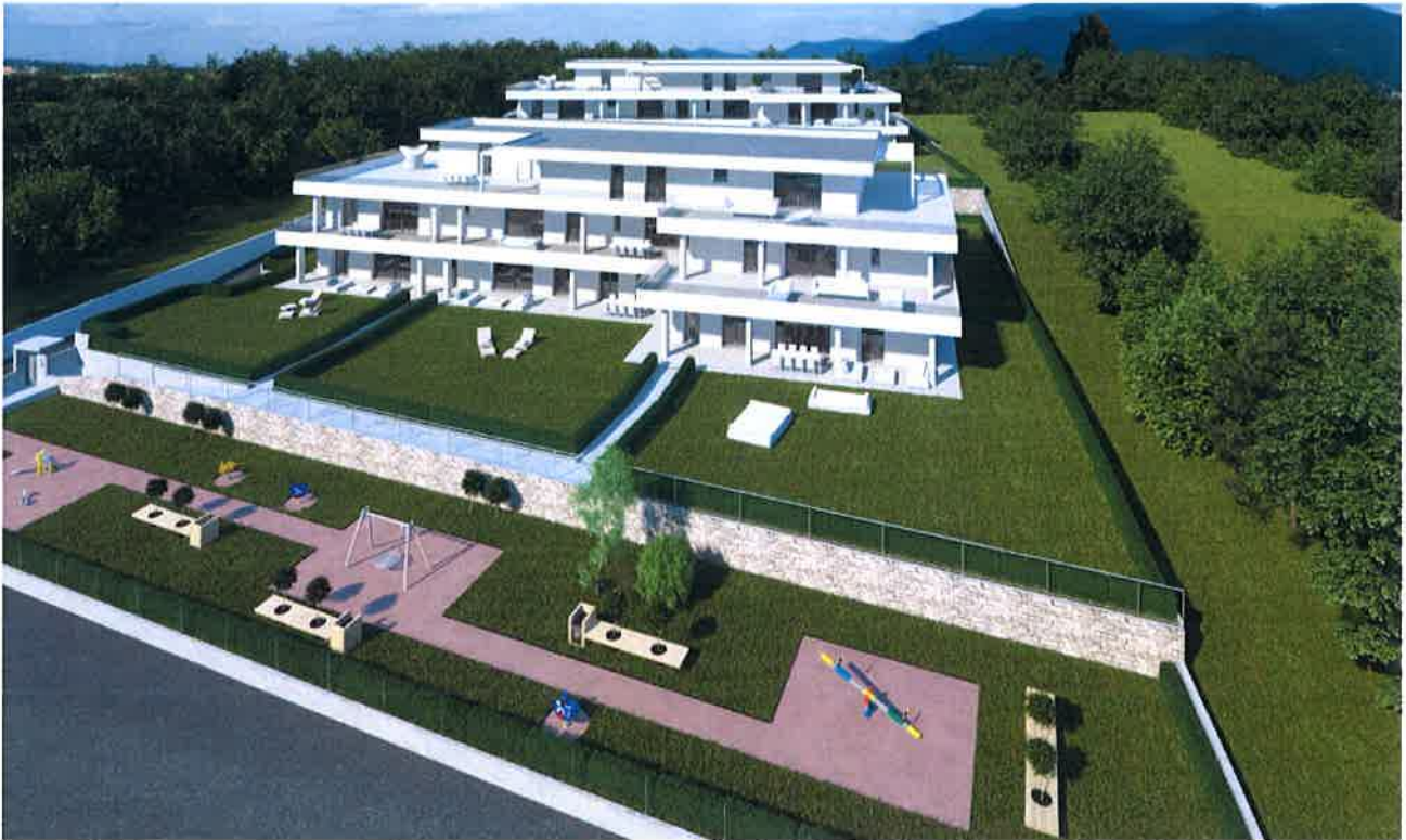
Figura 5. Ripresa fotografica aerea verso l'area di intervento.