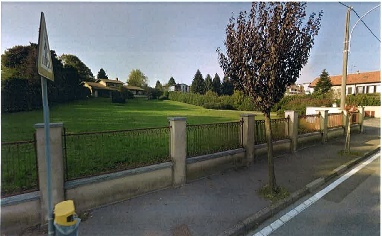
Figura 3. Ripresa fotografica da Via Cesare Battisti verso l'area di intervento.